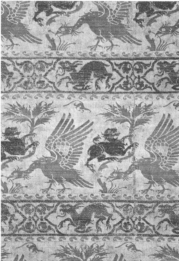
Abegg-Stiftung Riggisberg Seidenbrokat mit phantastischen Tieren, Lucca, 14. Jahrhundert

erlebte, welche zur Basis späterer Entwicklungen wurde. Dabei betätigen wir uns bewusst nicht auf Gebieten, die in der Schweiz bereits in erstklassigen Sammlungen zugänglich sind.