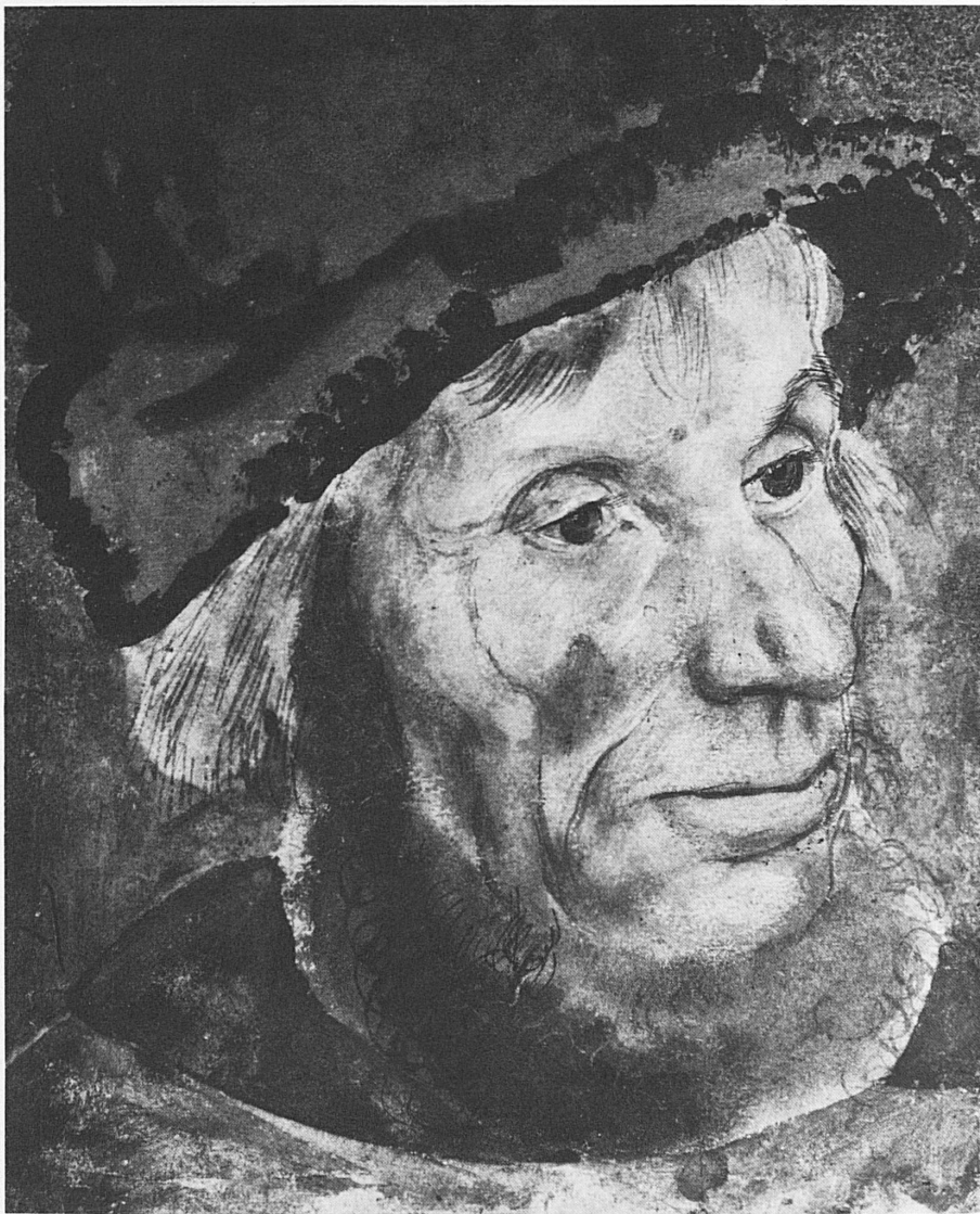
Lukas Cranach d. Ä.: Bauernkopf, um 1520, Aquarell, 19,2 × 15,6 cm, Kunstmuseum Basel