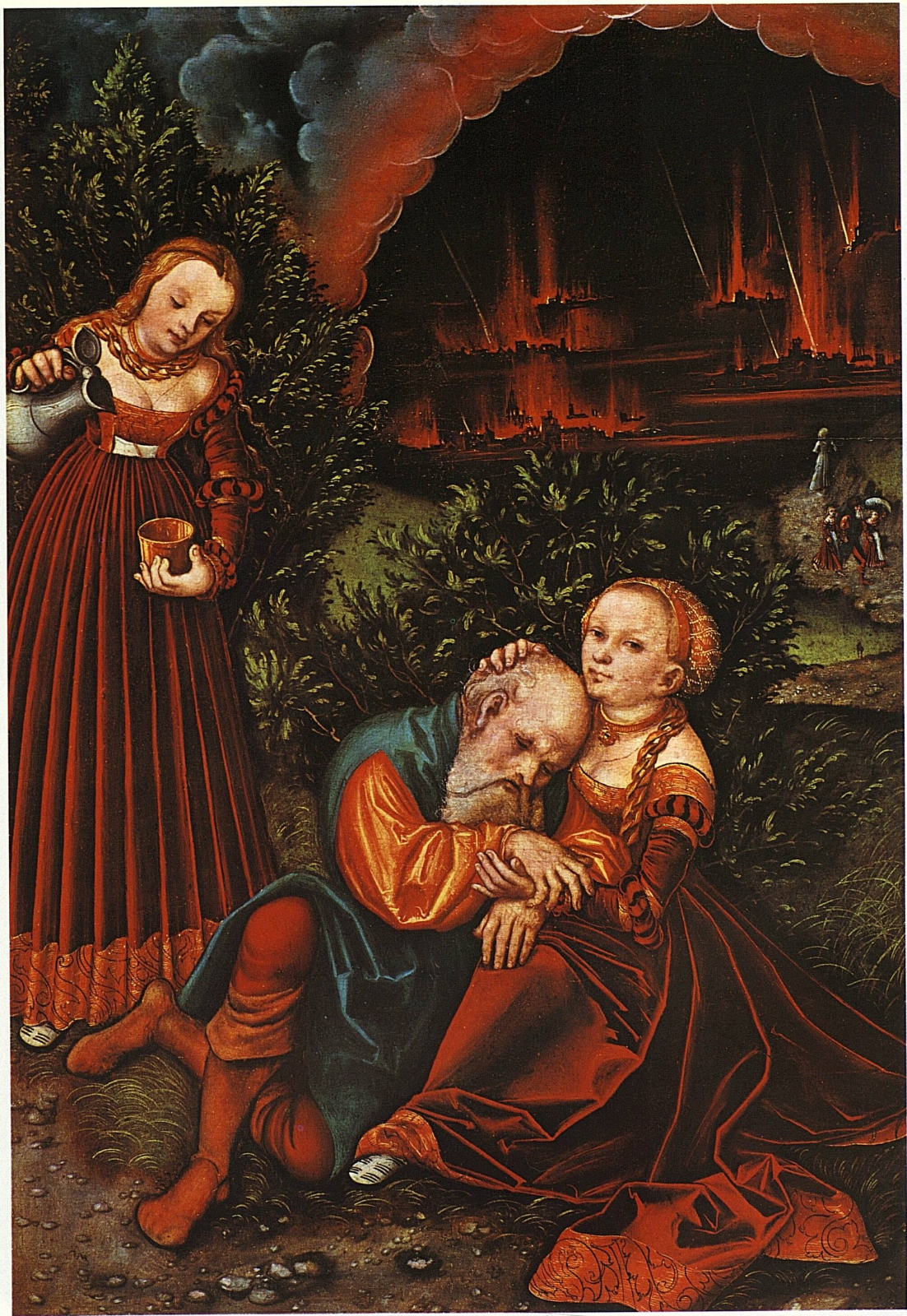
Lukas Cranach d. Ae.: Lot und seine Töchter, um 1530, 56 × 39 cm, Privatbesitz USA