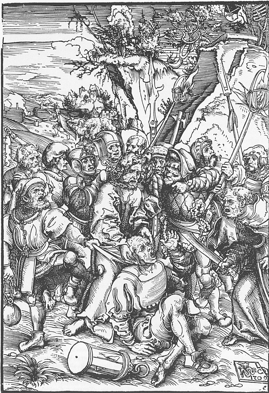
Lukas Cranach d. Ä.: Gefangennahme Christi, Holzschnitt, 1509, 25 × 17,2 cm. Der Spiess-träger am rechten Bildrand ist Cranachs Selbst-bildnis

Lucas Cranach l' Ancien: Appréhension du Christ, gravure sur bois, 1509, 25 × 17,2 cm. Cranach s'est représenté lui-même sous les traits du porteur d'épieu, à droite