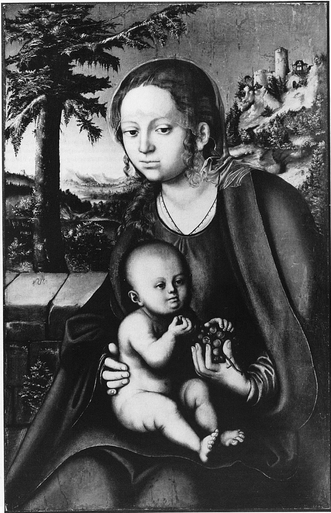
Lukas Cranach d.Ä.: Madonna, um 1510, 71 × 51, Sammlung Thyssen, Castagnola bei Lugano