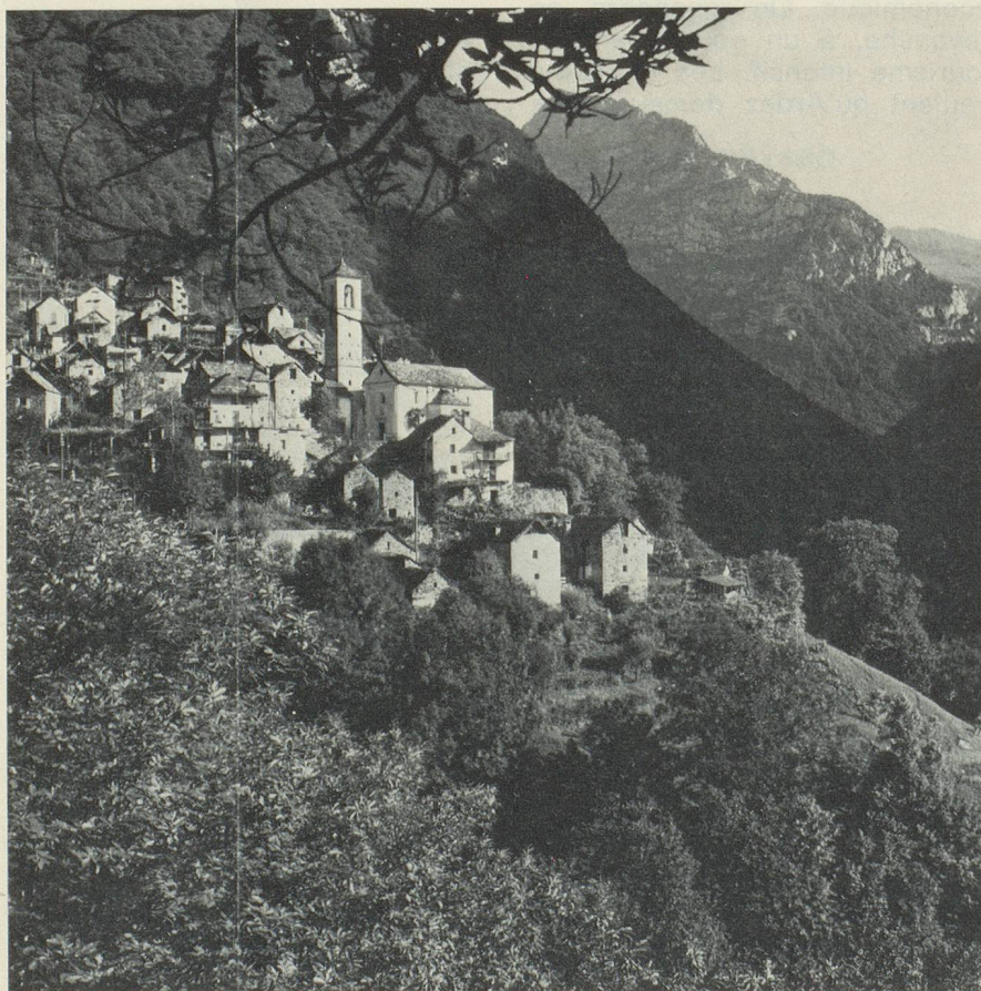
L'une des quatre réalisations exemplaires de Suisse pour l'Année européenne du patrimoine architectural 1975 : Corippo (Tessin) petit village aux maisons serrées dans le Val Verzasca.

de moutons. Les habitants gagnent leur pain à Locarno et dans les environs. Corippo forme encore un tout homogène. Le problème essentiel consiste à rendre à nouveau habitables les vieilles maisons délabrées. La sauvegarde de la localité exclut la construction de nouvelles maisons. Il convient au contraire de tout faire pour conserver à la population l'espace habitable traditionnel, équipé du confort indispensable. Parallèlement, il importe d'adapter l'infrastructure, d'améliorer les services, de créer une nouvelle base économique. Ce village tessinois ne doit pas devenir un « musée vivant ». Des projets de solution ont été élaborés depuis longtemps. Il faut espérer maintenant que, par l'effort particulier entrepris dans le cadre de l'année européenne, Corippo puisse devenir le modèle d'une réalisation pratique.