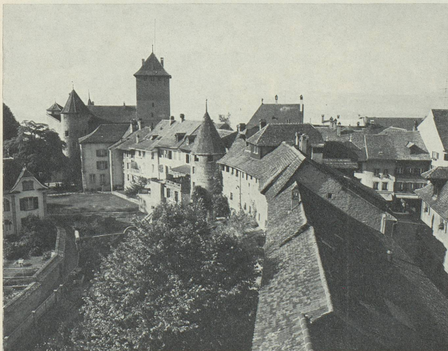
Morat (Pays de Fribourg), petite cité médiévale avec son enceinte très bien conservée.

communauté paysanne vivante, attrayante pour les gens qui y travaillent.