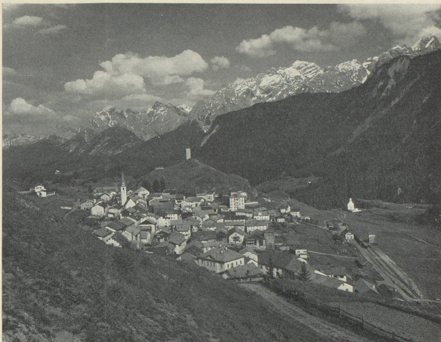
Ardez (Basse-Engadine). Le village s'intègre harmonieusement dans le paysage.

Ardez n'a plus connu de ces gigantesques incendies qui ont ravagé tant d'autres localités de la vallée ; la commune qui s'étale au pied du Steinsberg, marqué par son donjon surplombant la contrée, se présente comme l'ont connue les siècles. Tout au long de la rue principale se pressent les maisons de style engadinois, avec leurs larges portails, leur forte maçonnerie, leurs fenêtres étroites. Les façades de ces maisons sont fréquemment peintes ou ornées de sgraffites. La menace qui pèse en première ligne sur cet ensemble villageois unique, c'est l'abandon, car une restauration revient très cher. Il importe aujourd'hui, en premier lieu, de construire une route de contournement, ce que l'on s'apprête à faire. Des maisons vides ou mal utilisées, idéales pour le paisible tourisme familial, offrent une possibilité de développement économique. On renoncera, en revanche, à un équipement de tourisme intensif. Les habitants veulent qu'Ardez demeure une