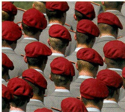
Gewinnung von Nachwuchs gehört zu den vorrangigen Aufgaben der Bundeswehr.

Als Bürger eines Landes, das sich wie die Schweiz mit dem Kauf von Kampfflugzeugen seit der Mirage-Affäre von 1964 derart schwer tut, würde ich mich aber aufs Glatteis