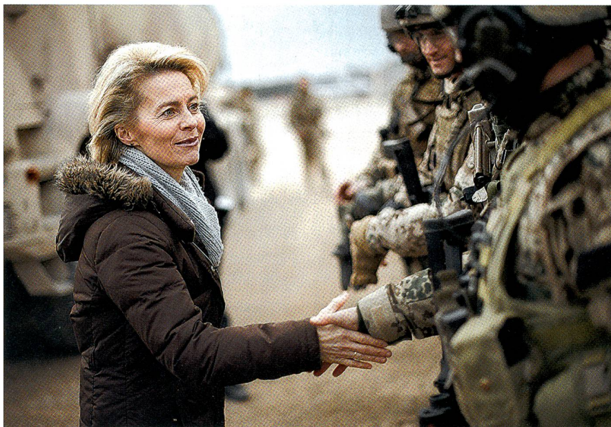
Verteidigungsministerin Ursula von der Leyen besucht oft und gern die Truppe.

Rüstungsprogramm 1984 beschlossenen Kauf von 380 Stück dieses Kampfpanzers keine Zweifel mehr hegte.