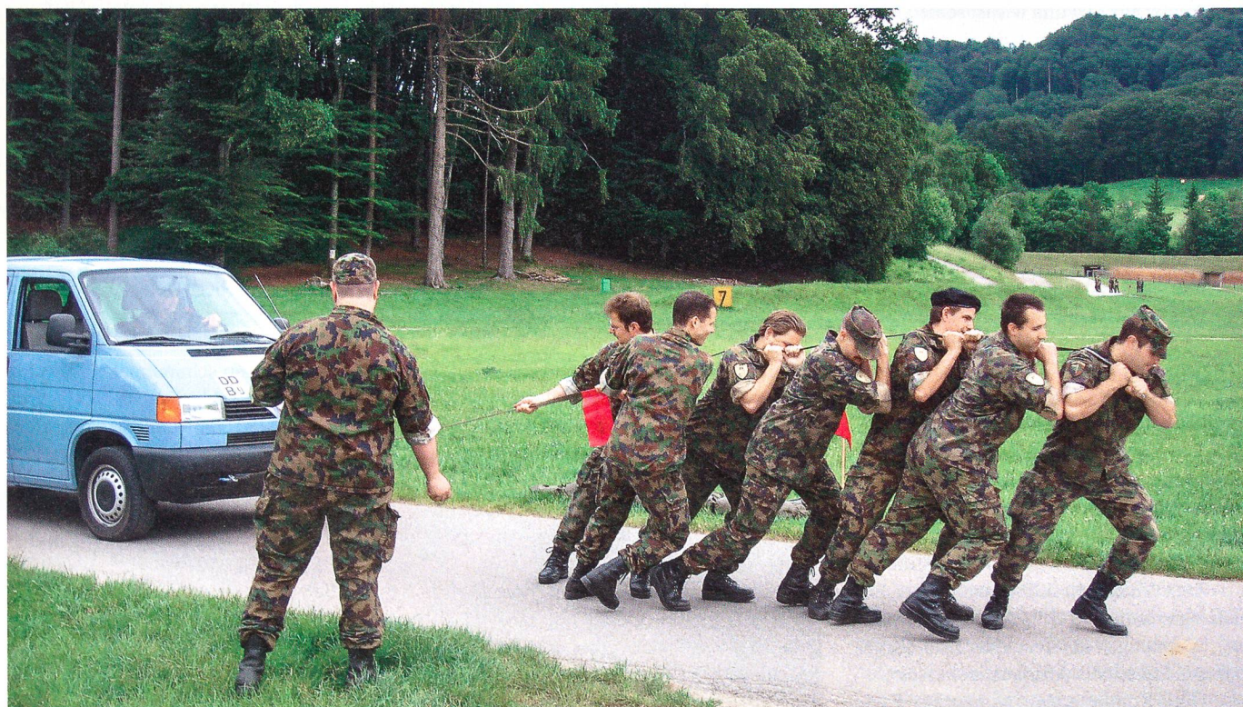
Sie ziehen am gleichen Strick – und das schwere Fahrzeug.

Wiederum Entschlussfassungsübung bei Posten 7. Rund um Bern tobt der Krieg. Der Zugführer ist gefallen. Der Postenchef gibt die militärische Lage bekannt, die Bestände an AdA und an Material sowie eine ausführliche Information über die feindliche Absicht. Ein Lageplan ist vorhanden, die Anzahl Gegner ist unbekannt. Auftrag: Die feindliche Artilleriestellung ist zu vernichten, der Bereitschaftsraum ist zu si-