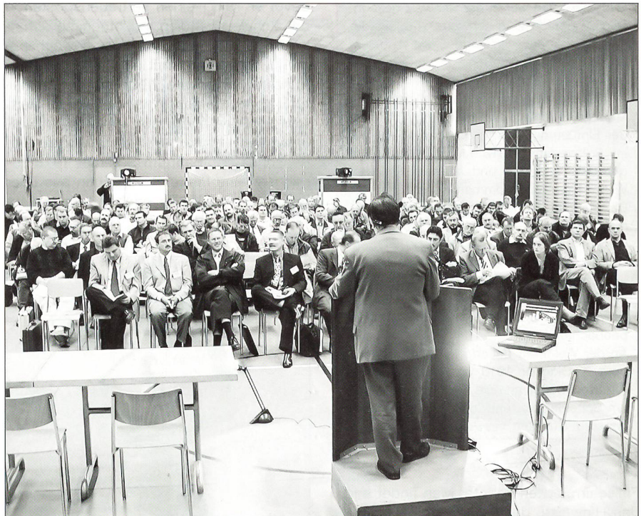
Über 160 Personen folgten gespannt den Ausführungen

Die erste Eingabe der Arbeitsgemeinschaft an die Planer der Armee XXI vom 29. Juni 1999 betreffend Funktionen, Aufgaben und Laufbahnen der Unteroffiziere ist zunächst nicht auf grosse Beachtung gestossen. Erst im Nachfassen gelang es in einer Besprechung mit dem Chef der Studie Ausbildung zu vermitteln, dass es hierbei um die Meinung aller Unteroffiziersverbände