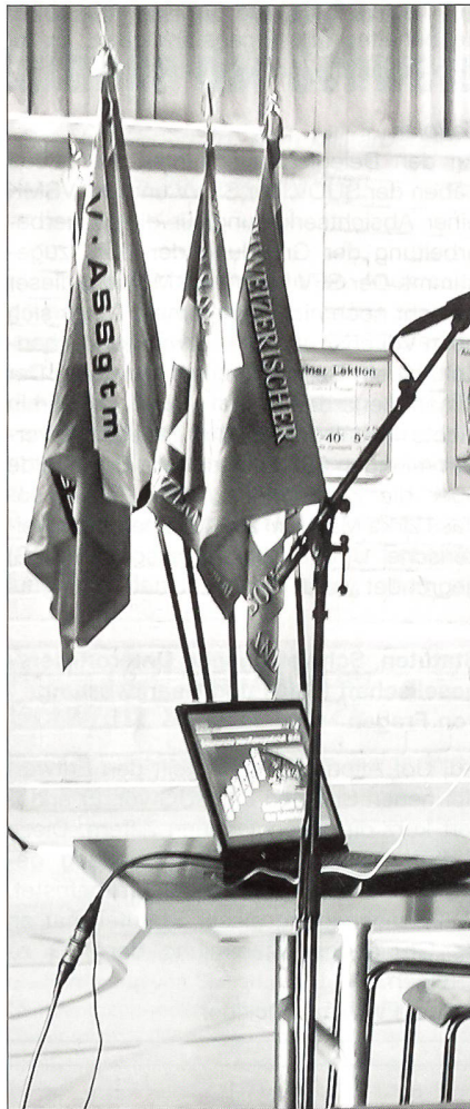
Unter den vier Verbandsfahnen

des Zugführerstellvertreters absolvieren.