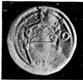
Wahlpfennig o. J. Kupfer