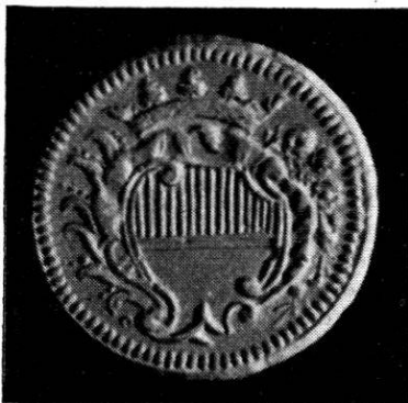
Wahlpfennig o. J. Kupfer