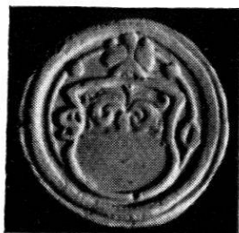
Wahlpfennig o. J. Zinn