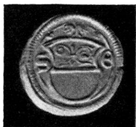
Wahlpfennig o. J. Kupfer