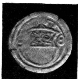
Wahlpfennig o. J. Kupfer