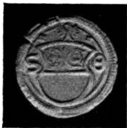
Wahlpfennig o. J. Kupfer