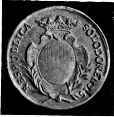
Wahlpfennig 1774 Silber