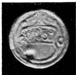
Wahlpfennig o. J. Kupfer