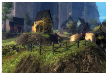
Guildwars 2: Im Spiel werden fünf humanoide Rassen, durch ihre eigene Architektursprache repräsentiert.