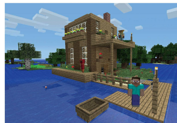
Minecraft: Die einfache Welt von Minecraft setzt sich aus verschiedenen Kosystemen zusammen.