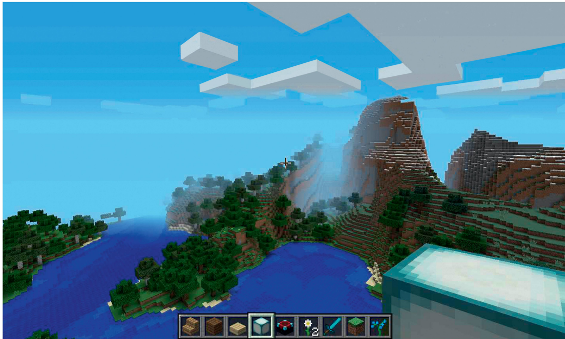
«Minecraft»: Innerhalb einer Tour in eine Richtung stösst der Spieler nach 60 Millionen Blocks oder rund 35 Stunden Realspielzeit an die Systemgrenze.

den. In Zusammenarbeit mit dem Designteam und der Grafik entwickelt ein Leveldesigner die Umwelt. Er entwirft Gestalt und Funktionen und ist für das Landschafts- und Gebäudedesign zuständig. Dazu muss er Aufgaben als Architekt, Landschafts- und Städteplaner erfüllen. Die Grafikabteilung setzt mit der Designidee die Charaktere und die Umwelt um und modelliert dazu die Objekte. Für die Figuren, Kreaturen und Gebäude fertigen 3-D-Artists mit Software, die auch in der Architekturvisualisierung zum Einsatz kommt, dreidimensionale Modelle an (vgl. «Frei im 3-D-Raum», S. 30). Die Abteilung Programmierung, oder in kleineren Firmen der Designer, setzt das Spiel technisch in eine funktionierende Software um. Die Benutzeroberfläche, die dem Spieler detaillierte Informationen über das Spielgeschehen gibt, erstellt der User-Interface-Designer mit der Programmierabteilung.