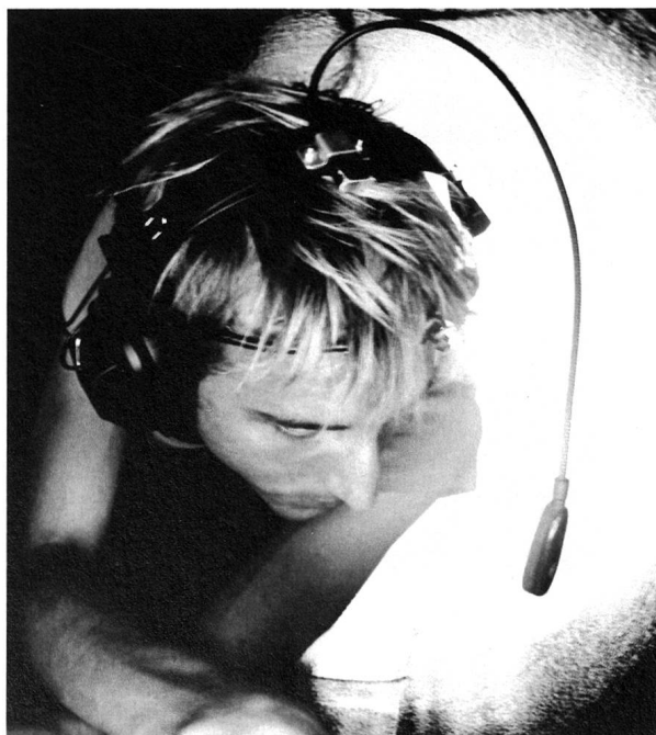
Selbsternannter Cyborg: Neil Harbisson