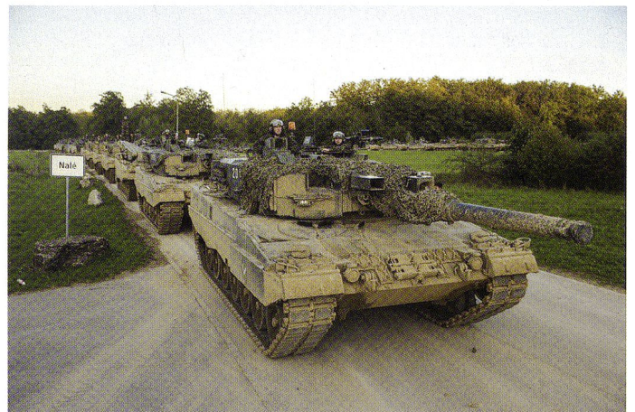
La compagnie BRAVO : dans le terrain.

A titre d'exemple, citons la préparation du REDIMA par le sergent-major d'unité. Ce dernier doit impérativement