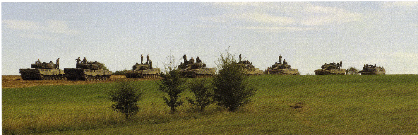
A la fin de chaque exercice est effectué une critique; puis aussitôt on se prépare pour le prochain passage.