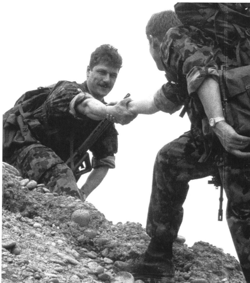
Camaraderie et solidarité.

Que notre armée démissionne est une évidence: il suffit pour s'en convaincre de considérer la spectaculaire augmentation des licenciements dans les écoles de recrues. Mais elle peine également à séduire et à susciter l'avancement, comme le montre la diminution de moitié du nombre d'aspirants officiers en dix ans. Il manque clairement à l'institution militaire un outil de recherche et d'évaluation sociologique qui lui fournirait les tendances en termes de personnalités, d'aptitudes et d'aspirations au sein des futurs conscrits, car les éléments mentionnés plus haut