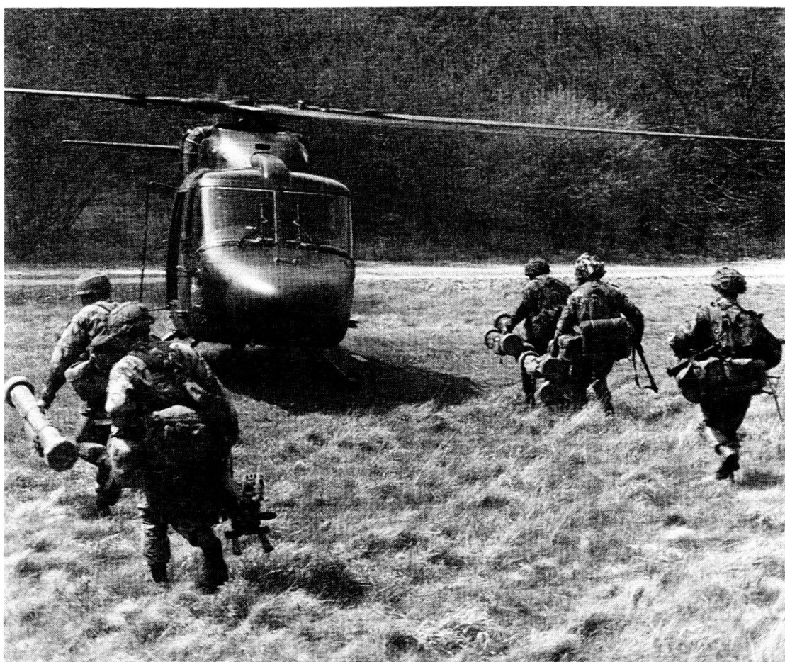
Grazie allo spazio di carico, l'elicottero Lynx può anche trasportare nella zona del fronte dei «Commandi-killer-anticarro» e sbarcarli.

La disponibilità immediata e l'utilizzazione della terza dimensione permettono l'impiego offensivo di mezzi aerei da trasporto, per esempio portando con elicotteri i granatieri in una posizione favorevole da cui essi potrebbero tagliare l'afflusso di riserve nemiche, eliminare posti di combattimento avanzati avversari, oppure appoggiare contrattacchi sui fianchi. Gli elicotteri da trasporto sono dunque uno dei pochi mezzi che aiutano il difensore a passare dalla difensiva all'offensiva.