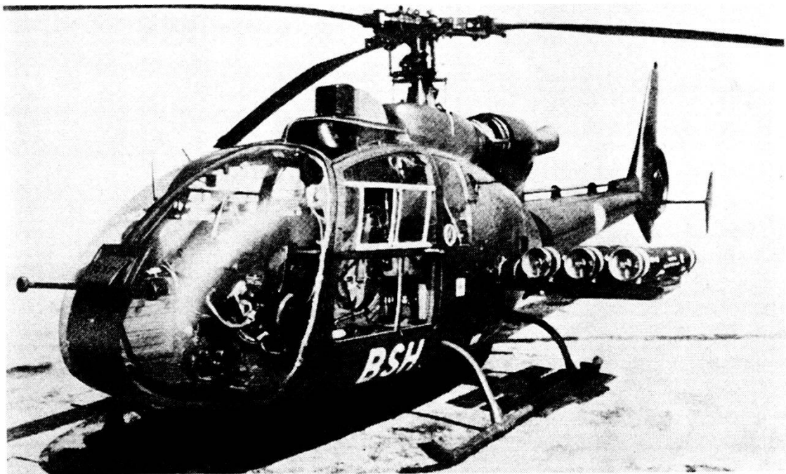
Elicottero anticarro Gazelle SA 342 dell'esercito francese.

Come vede il pilota dell'elicottero un carro armato ad una distanza di 4 km?