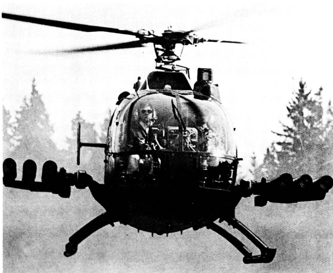
PAH 1, BO 105 con ordigno teleguidato HOT (fabbricazione: Messerschmitt-Blohm-Bölkow).

• logorare forze avversarie di secondo scaglione che affluiscono al fronte. Le esperienze con il PAH-1, i progressi della tecnologia degli elicotteri, lo sviluppo all'estero e il cambiamento dell'immagine della minaccia, tutti questi elementi portano a dedurre che i PAH, utilizzati come elemento singolo della mobilità aerea nel combattimento a fuoco delle forze terrestri, sono impiegati sotto il loro potenziale valore. L'esempio noto a tutti dell'Arma corazzata che uomini come Fuller, de Gaulle e Guderian hanno cercato di liberare dal legame tattico con la fanteria per portarla all'indipendenza operativa, potrebbe ora ripetersi nell'ambito della condotta operativa aeromobile.