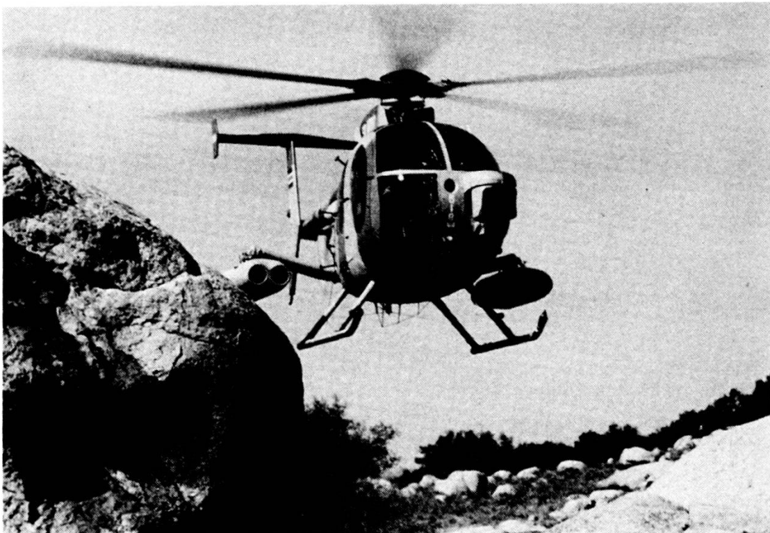
Elicottero Hughes 500 MD Defender con ordigni teleguidati TOW. Davanti a destra l'apparecchio di mira elettro-ottico.