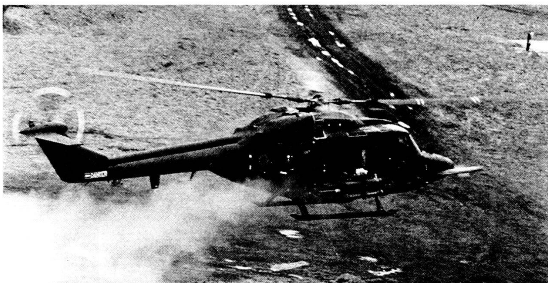
Elicottero britannico Lynx della Westland. Armamento principale: 8 armi anticarro TOW o Milan. Una dotazione di riserva può essere trasportata nello spazio di carico.

Una protezione DCA dell'artiglieria, sufficientemente efficace contro gli elicotteri da combattimento, serve in ultima analisi a garantire il più a lungo possibile l'appoggio di fuoco alle nostre truppe combattenti.