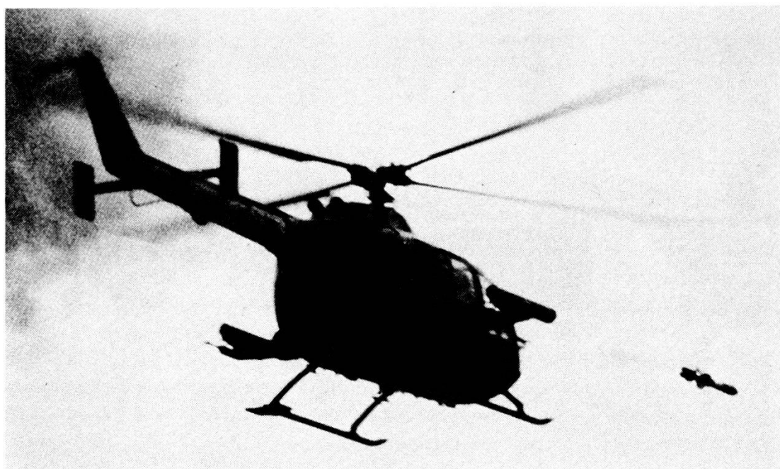
Elicottero BO 105 mentre lancia un ordigno teleguidato HOT.

Per l'impiego del cannone e della mitragliatrice, il tempo d'esposizione è di circa 15 fino a 20 secondi; per i razzi non guidati da 12 a 20 secondi e per gli ordigni teleguidati, il tempo necessario va da 15 fino a 30 secondi. Tuttavia, la ricerca e lo sviluppo permetteranno di ridurre notevolmente questi tempi.