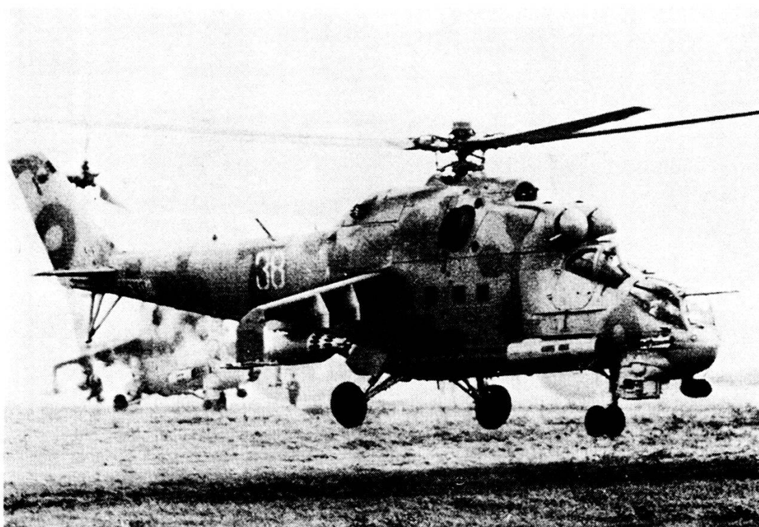
Mi-24 HIND/E con supporto doppio per AT-6 Spiral, contenitore razzi UB-32 e, nuovo, nella parte anteriore della fusoliera una cabina con un cannone doppio automatico di 23 mm.

Con ciò, diventa evidente che gli elicotteri armati sono strettamente legati nel