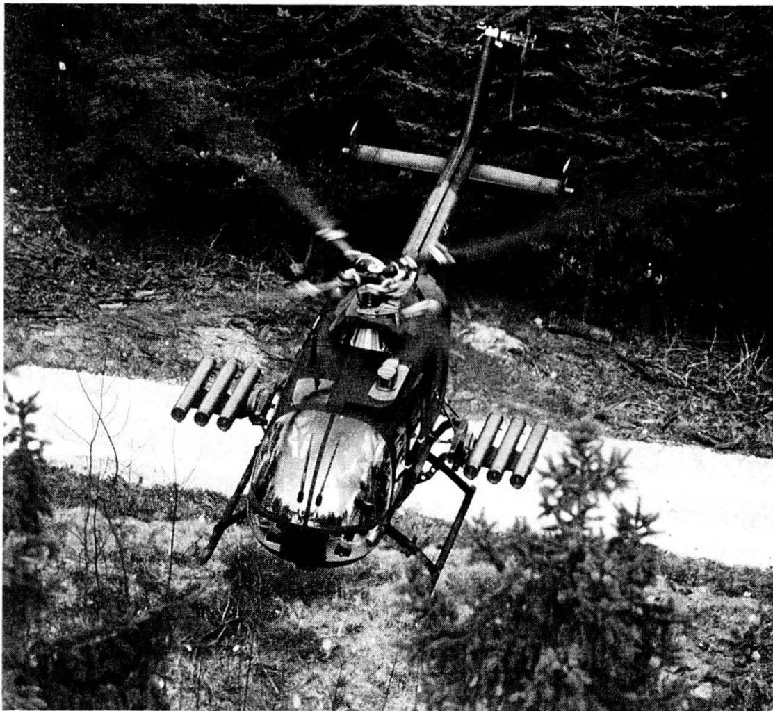
L'elicottero tedesco BO-105 PAH, fabbricato dalla Messerschmitt-Blohm-Bölkow.