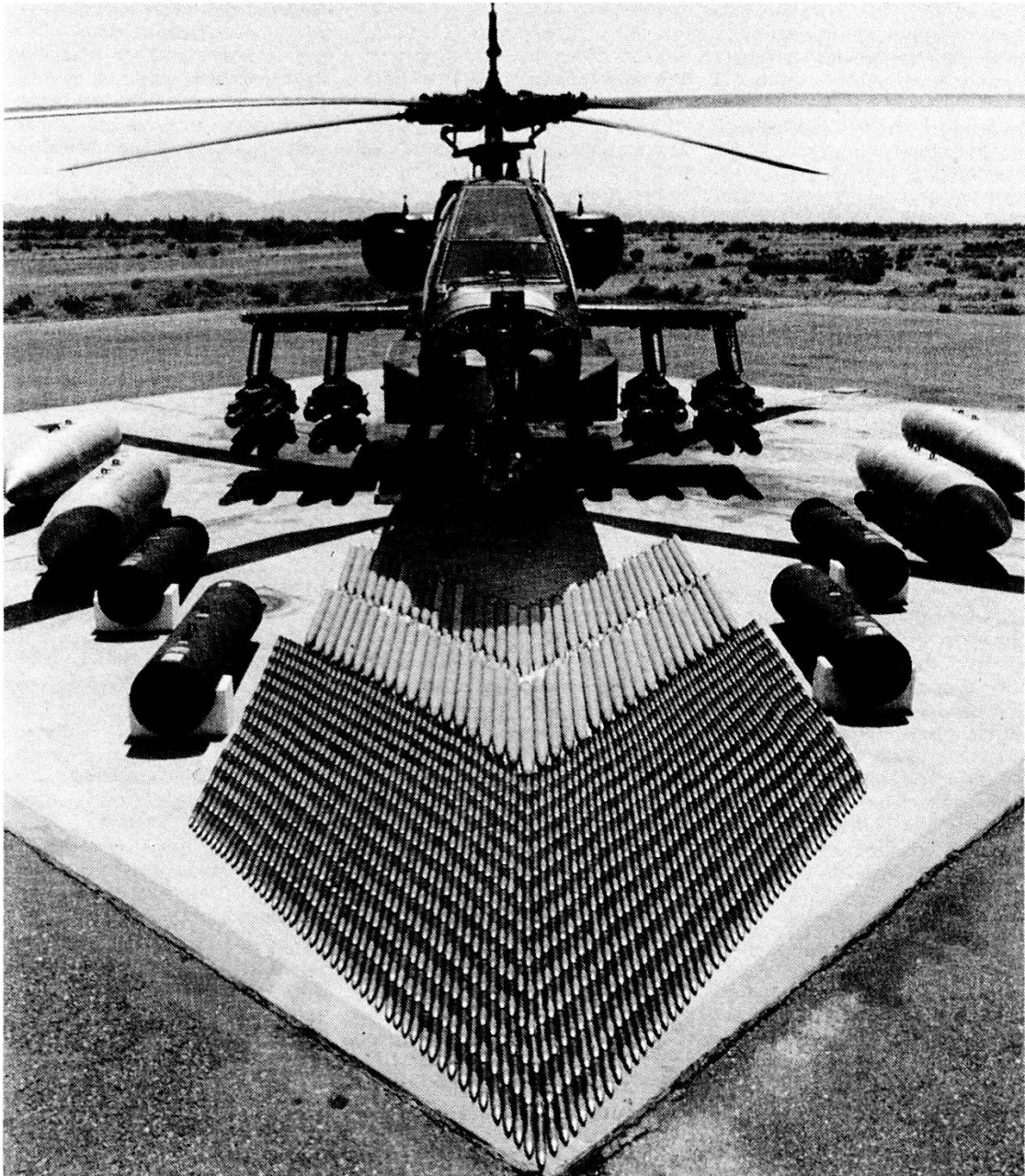
AH-64 Apache della Hughes USA. Armamento: 16 ordigni teleguidati Hellfire (sotto le ali); 76 razzi 2,75 inch; 1200 proiettili di cannone 30 mm. Apparecchio per la ricerca e l'attribuzione d'obiettivo, combinato con apparecchio per la direzione del tiro (giorno + notte), nel naso dell'elicottero.