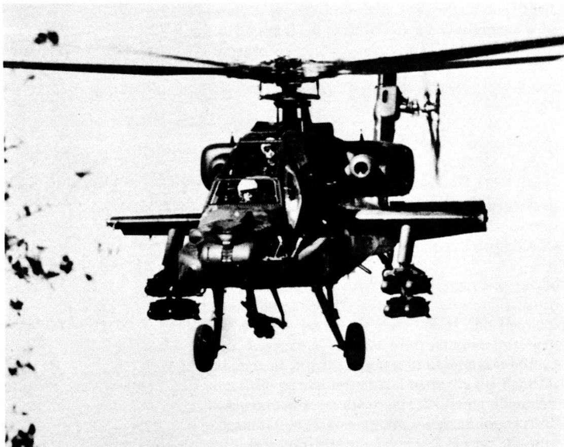
Elicottero da combattimento AH-64 Apache (USA).