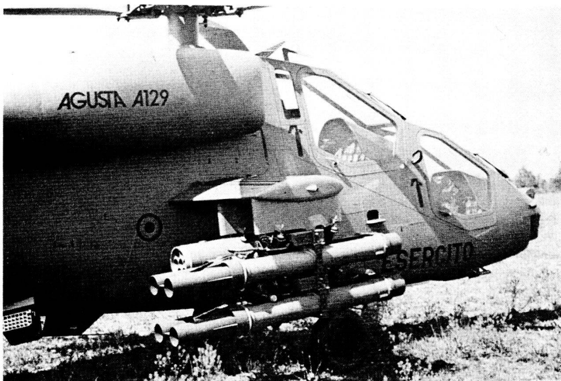
L'elicottero italiano Agusta A 129 Mongoose dell'Agusta Milano. Armamento: 8 ordigni teleguidati TOW; inoltre, in alternativa, razzi e/o mitr di calibri diversi.

La lotta contro gli elicotteri condotta con i propri mezzi contraerei avviene nell'ambito dell'unità di fuoco; l'apprezzamento del terreno e l'identificazione dei corridoi d'avvicinamento o degli spazi d'attesa, particolarmente adatti per l'elicottero da combattimento, assumono una importanza determinante. Il cannone contraereo 20 mm ha avuto una notevole rivalutazione nella lotta contro gli elicotteri, per merito della sua insensibilità nei confronti dei disturbi elettronici, della sua mobilità ed anche grazie ai suoi effettivi relativamente consistenti. La difesa contraerea non può mai essere senza lacune; nella lotta contro gli elicotteri bisogna dare maggiore importanza alla «difesa contraerea di tutte le truppe». Le truppe d'aviazione e di difesa contraerea dispongono di una rete efficiente di sensori, centrali d'interpretazione e d'intervento (servizio avvistamento segnala-