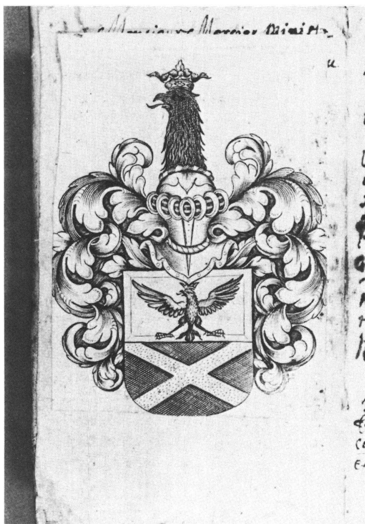
Fig. 5. Ex-libris de Jacob Constant de Rebecque.