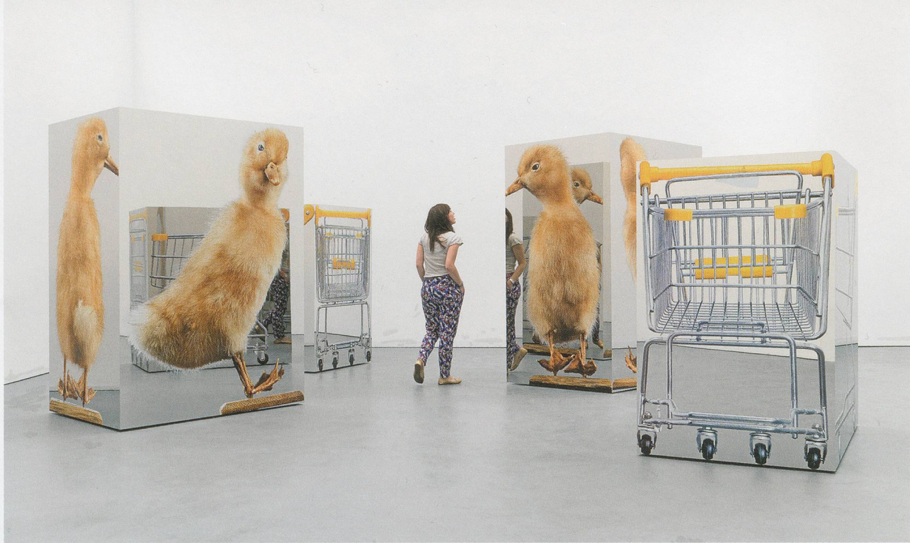
URS FISCHER, FRITZ LANG / SHORTY, 2010, silkscreen print on mirror-polished stainless-steel sheets, polyurethane foam sheets, two-component polyurethane adhesive, stainless-steel beams, aluminum L-sections, screws; in four parts, Shopping cart, each: 64 \frac{3}{4} \times 40 \frac{1}{2} \times 57 \frac{1}{2} ", Ducky, each: 82 \frac{5}{8} \times 57 \frac{1}{2} \times 43 \frac{1}{4} " / Siebdruck auf spiegelpolierten Edelstahlplatten, Polyurethan-Schaum-Platten, Zwei-Komponenten-Polyurethan-Klebstoff, Edelstahl-Träger, Aluminium-L-Profile, Schrauben; in vier Teilen, Einkaufswagen, je 164,5 \times 103 \times 146 cm, Entchen, je: 210 \times 146 \times 110 cm.