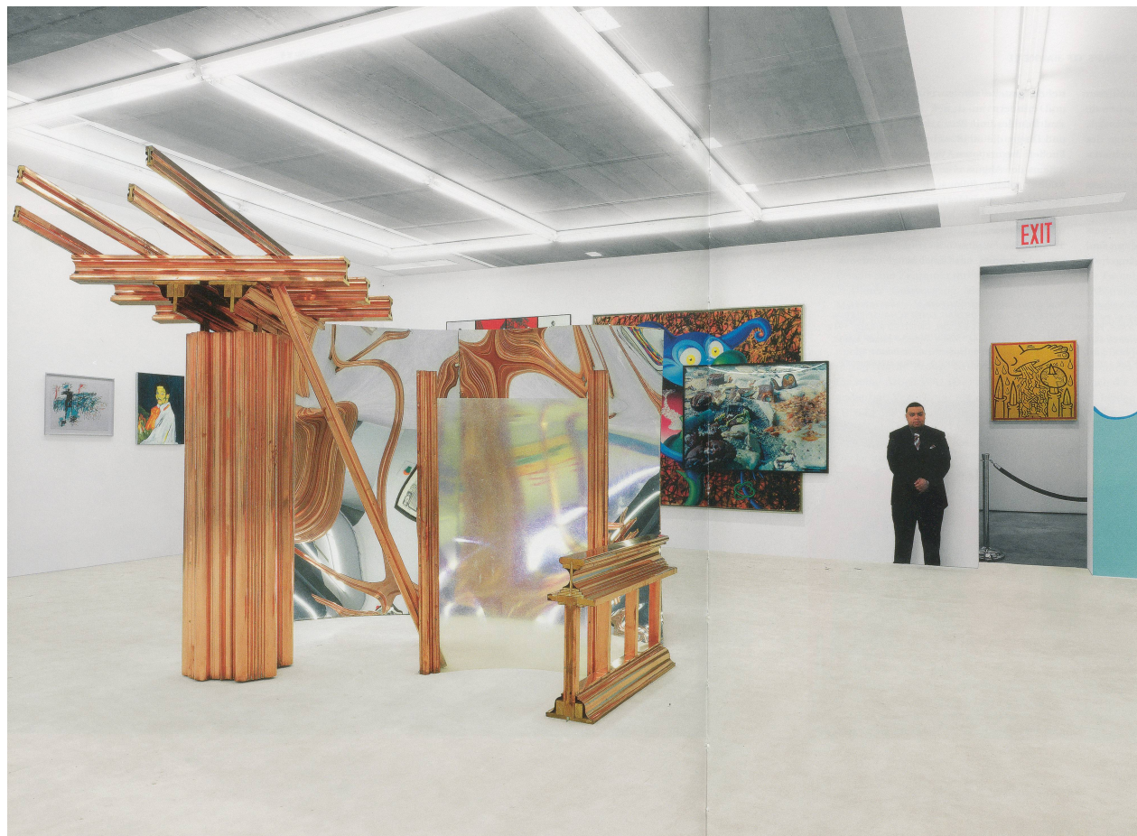
URS FISCHER, ABSTRACT SLAVERY, 2008, wallpaper prints of photographic reproductions of interior spaces, dimensions variable, artworks installed on top of wallpaper; MIKE BIDLO, NOT PICASSO (SELF-PORTRAIT); YO, PICASSO, 1901), 1986; CINDY SHERMAN, UNTITLED #175, 1987; Sculpture on floor: ROBERT MORRIS, UNTITLED, 1978, installation view, "Who's Afraid of Jasper Johns?", Tony Shafrazi Gallery, New York / ABSTRAKTE SKLAVEREI, Tapetendrucke photographisch reproduzierter Innensäume, Masse variabel.