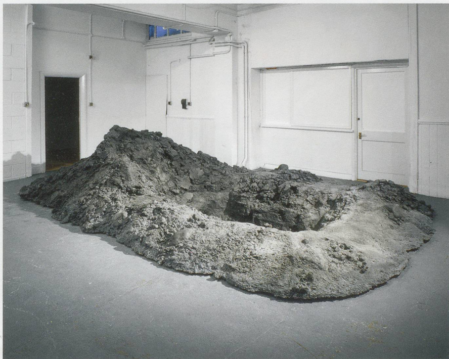
URS FISCHER, UNTITLED (HOLE) , 2007, cast aluminum, 212 \frac{1}{2} \times 133 \frac{7}{8} \times 106 \frac{1}{4} ", installation view, "Uh...", Sadie Coles HQ, London / OHNE TITEL (LOCH) , Aluminiumguss, 540 \times 340 \times 270 cm.

In their almost sculptural opposition between the "image" behind and the "object" in front, the "PROBLEM PAINTINGS" show Fischer continuing to think through these same issues. Photography is here employed to tackle one of the most fundamental challenges of figurative painting: how to depict volumetric mass and space on a flat plane. Walking around with Fischer in the well-orchestrated chaos of his studio, it strikes me that despite appearances to the contrary, he is less a maker of objects than a producer of images, whether in two or three dimensions. Or perhaps, better yet, we might resurrect another term even more antiquated than studio, and say that what he creates are tableaux.