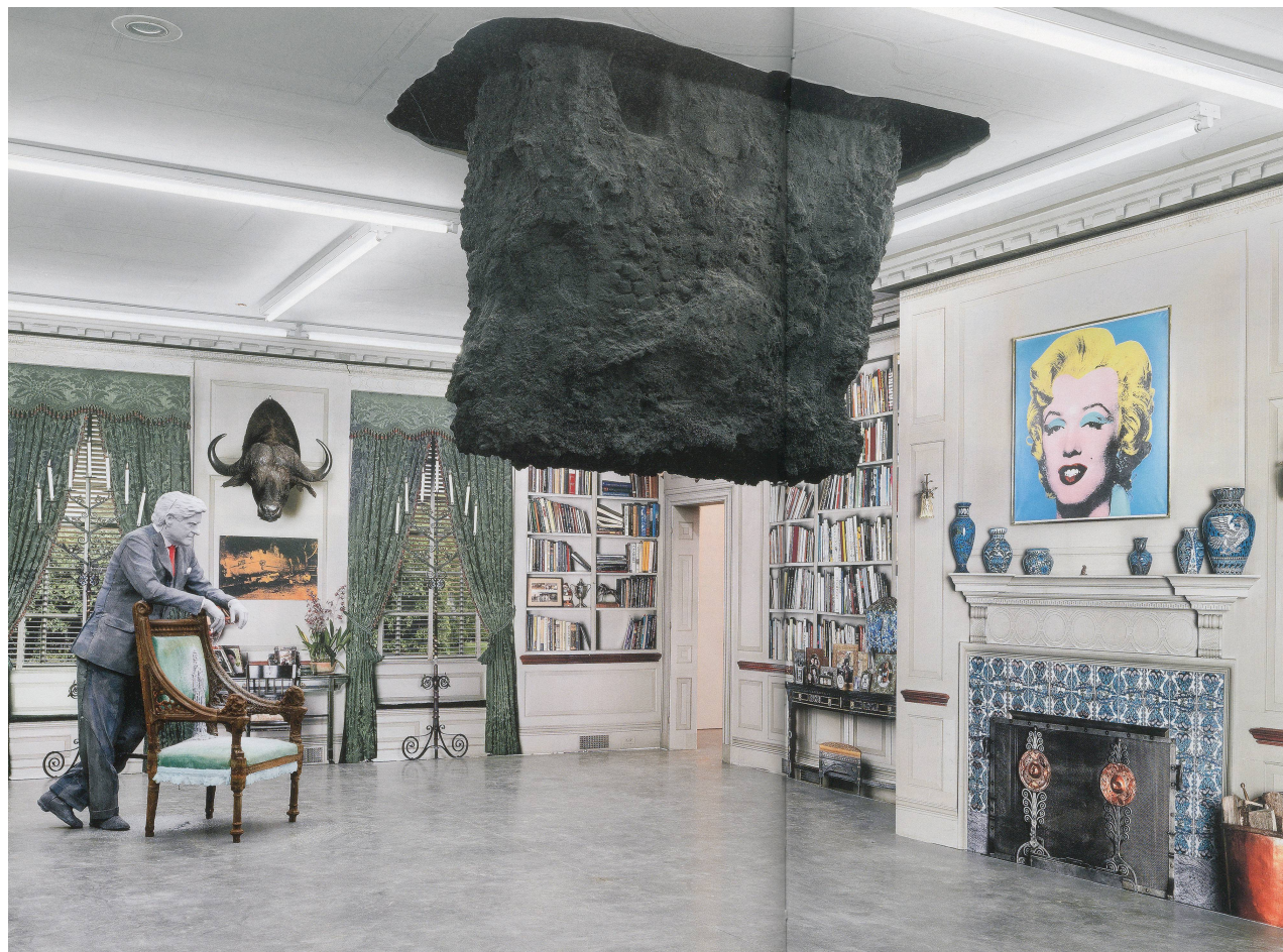
URS FISCHER, ABSTRACT SLAVERY , 2008, wallpaper prints of photographic reproductions of interior spaces, dimensions variable; UNTITLED (HOLE) , 2007, cast aluminum, 212 1/2 x 133 1/2 x 106 1/2"; UNTITLED (STANDING) , 2010, paraffin wax mixture, pigment, steel, wicks, 77 x 31 x 52", "Oscar the Grouch," The Brant Foundation Art Study Center, Greenwich, Connecticut, 2010–2011, installation view / ABSTRAKTE SKLAVEREI , Tapetendrucke photographisch reproduzierter Innenräume, Masse variabel, OHNE TITEL (LOCH), Aluminiumguss, 540 x 340 x 270 cm; OHNE TITEL (STEHEND), Paraffin-Wax-Mischung, Pigment, Stahl, Döchte, 195,6 x 78,7 x 132,1 cm.