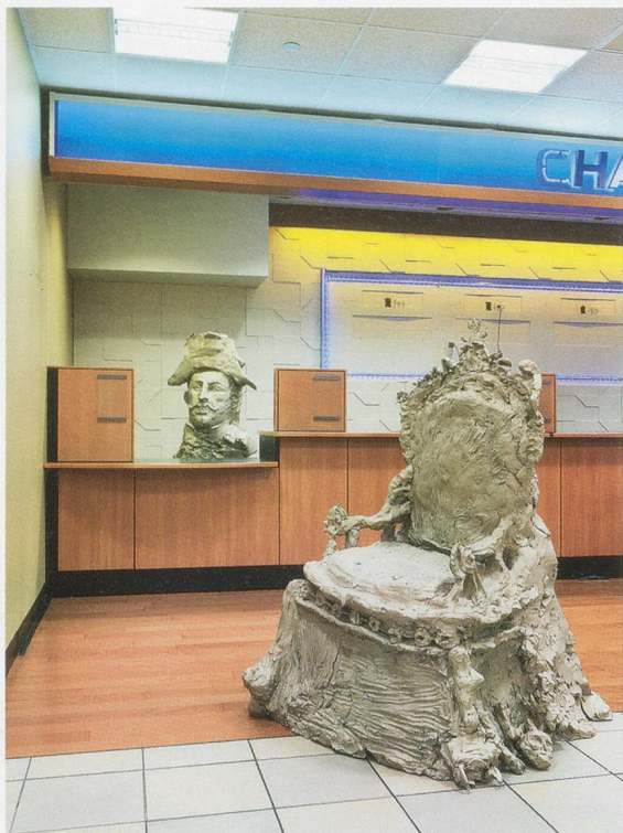
URS FISCHER, NAPOLEON, 2014, cast bronze, 71 x 42 x 48"; LOUIS XIV, 2014, cast bronze, 60 x 43 1/2 x 48 1/2", installation view, "mermaid / pig / bro w/ hat," Gagosian Gallery at 104 Delancey Street, New York / NAPOLEON, Bronzeguss, 180,3 x 106,7 x 121,9 cm; LOUIS XIV, Bronzeguss, 152,4 x 110,5 x 123,2 cm.

rend ich in seinem Atelier herumgehe, erinnert die Anzahl der in Arbeit befindlichen Werke und die verschiedenen Medien und Formen, in denen sie alle gleichzeitig daherkommen, eher an eine Gruppenausstellung als an das Werk eines bestimmten Künstlers zu einem bestimmten Zeitpunkt.