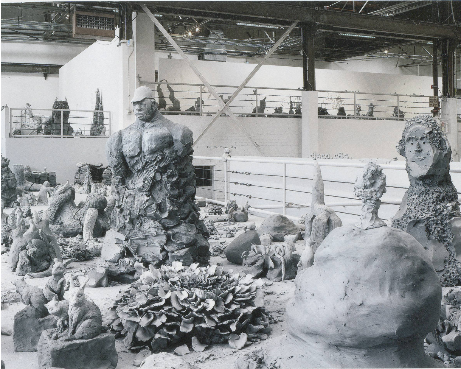
URS FISCHER and VARIOUS ARTISTS, YES, 2011–ongoing, unfired clay sculptures modeled on-site by multiple authors, dimensions variable, installation view, "Urs Fischer," The Geffen Contemporary, The Museum of Contemporary Art, Los Angeles, 2013 / JA, ungebrannte Tonskulpturen vor Ort von verschiedenen Künstlern modelliert, Masse variabel, Installationsansicht.