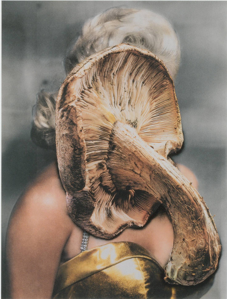
URS FISCHER, PROBLEM PAINTING , 2012, milled aluminum panel, aluminum honeycomb, two-component polyurethane adhesive, wood, screws, acrylic primer, gesso, acrylic ink, spray enamel, acrylic silkscreen medium, acrylic paint, 141 \frac{3}{4} x 106 \frac{3}{8} x 1" / PROBLEM GEMÄLDE , gewalztes Aluminiumpaneel, Aluminium-Wabenplatte, Zwei-Komponenten-Polyurethane-Klebstoff, Holz, Schrauben, Acrylgrundierung, Kreidegrundierung, Acryltinte, Spraylack, Acrylsiebdruck, Acrylfarbe, 360 x 270 x 2,5 cm. (COURTESY OF THE ARTIST / PHOTO: MATS NORDMAN)

Page 53: URS FISCHER, SMALL PROBLEM , 2012, aluminum panel, aluminum honeycomb, two-component epoxy adhesive, two-component epoxy primer, acrylic primer, gesso, acrylic ink, spray enamel, acrylic silkscreen medium, acrylic paint, 96 x 72 x 1 \frac{1}{4} " / KLEINES PROBLEM , Aluminiumpaneel, Aluminium-Wabenplatte, Zwei-Komponenten-Epoxyd Klebstoff, Zwei-Komponenten-Epoxydgrundierung, Acrylgrundierung, Kreidegrundierung, Acryltinte, Spraylack, Acrylsiebdruck, Acrylfarbe, 243,9 x 182,9 x 3,2 cm. (COURTESY OF THE ARTIST / PHOTO: MATS NORDMAN)