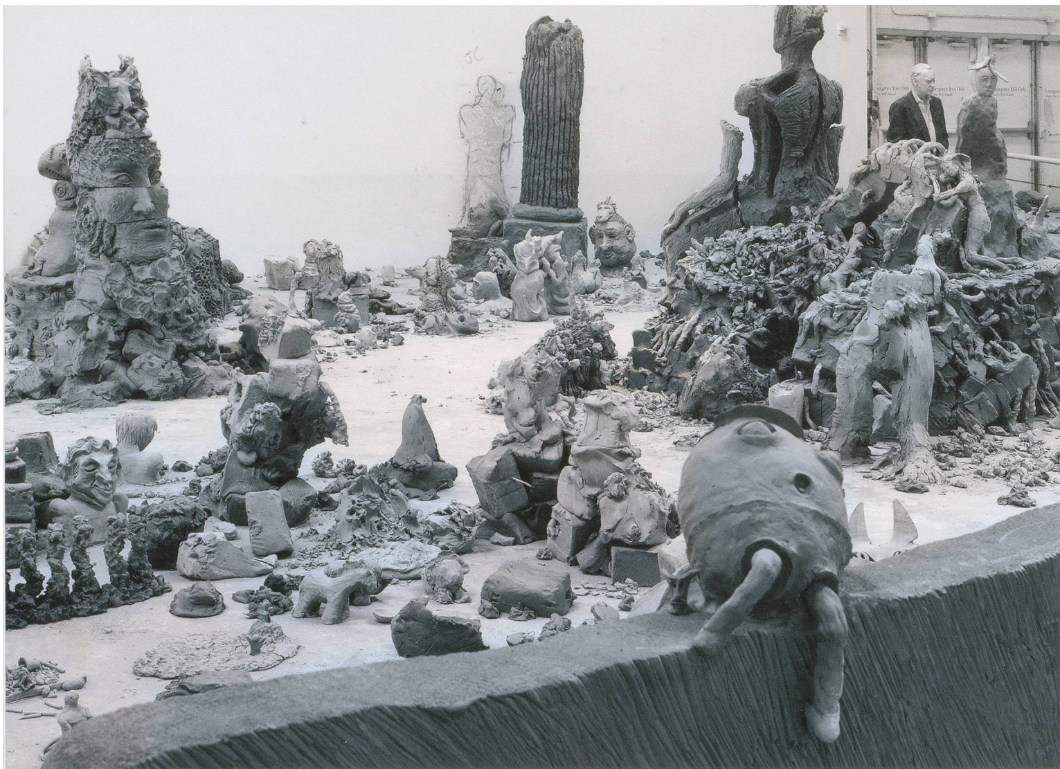
URS FISCHER and VARIOUS ARTISTS, YES, 2011–ongoing, unfired clay sculptures modeled on-site by multiple authors, dimensions variable, installation view, "Urs Fischer," The Geffen Contemporary, The Museum of Contemporary Art, Los Angeles, 2013 / JA, ungebrannte Tonskulpturen vor Ort von verschiedenen Künstlern modelliert, Masse variabel, Installationsansicht. (COURTESY OF THE ARTISTS / PHOTO: STEFAN ALTENBURGER)

das eigentliche Zentrum des Ateliers zu sein. Nicht minder wichtig sind die zwischen den Hightechgeräten – und punkto Grösse und Produktionstempo industriell anmutenden Apparaturen – eingerichteten Spielzonen für Kinder; sie werden auch heute von Fischers Tochter und deren Freundinnen und Freunden genutzt. Dies scheint mir ein grundsätzliches Merkmal zu sein, das Fischers häufig gigantische Werke, seine überschäumende