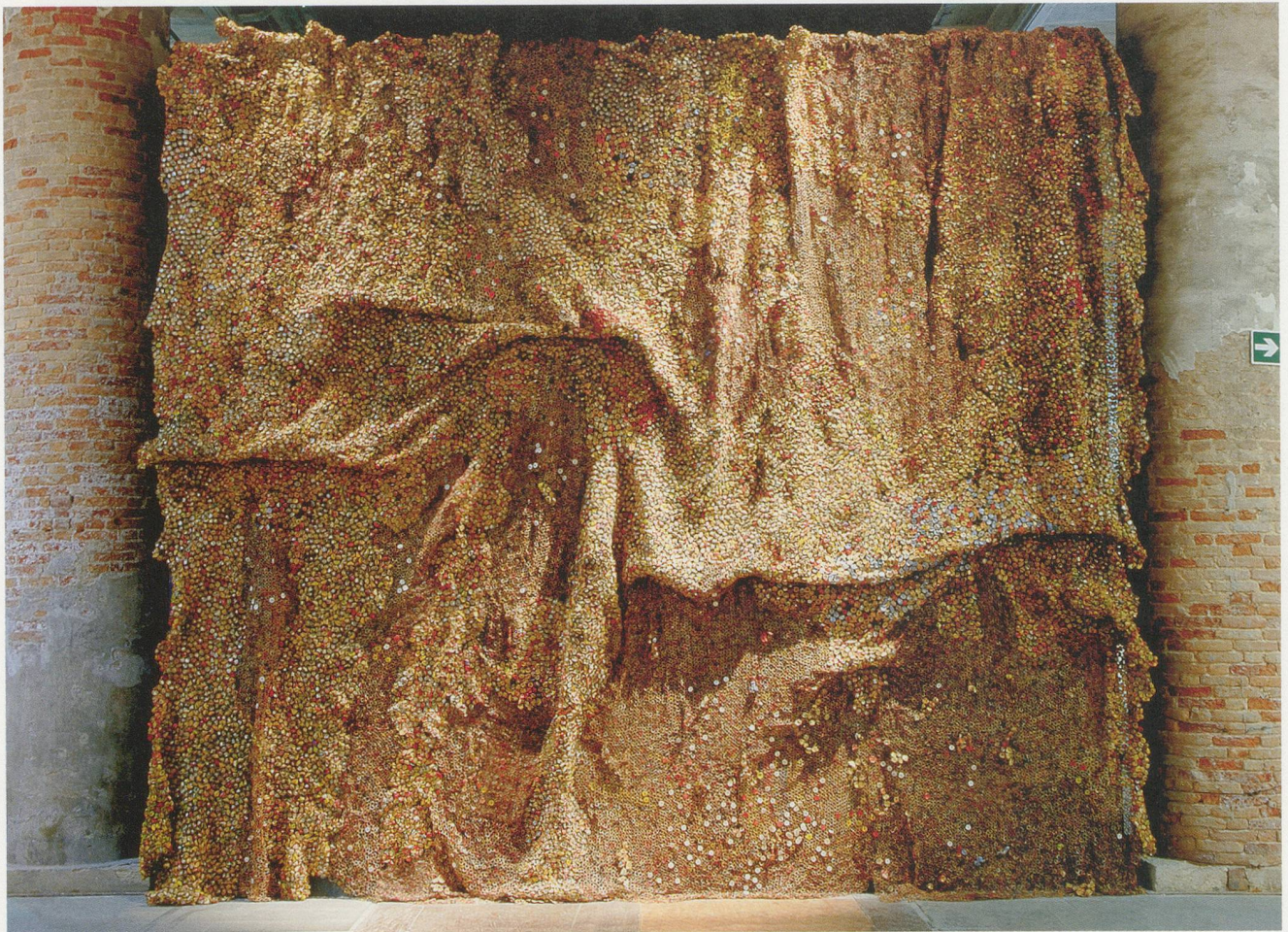
EL ANATSUI, DOUSASA II, 2007, aluminum bottle tops, copper wire, 287 3 / 4 x 360" / Aluminium-Kronkorken, Kupferdraht, 731 x 914 cm.