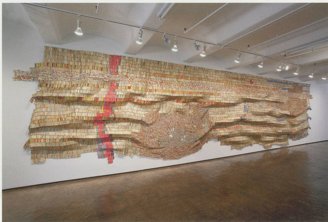
EL ANATSUI, INTERMITTENT SIGNALS, 2009, aluminum bottle tops, copper wire, 131 1/2 x 493" / UNTERBROCHENE SIGNALE, Aluminium-Flaschenverschlüsse, Kupferdraht, 334, 1252 cm.

4) "El Anatsui in Conversation with Chika Okeke-Agulu," p. 10.