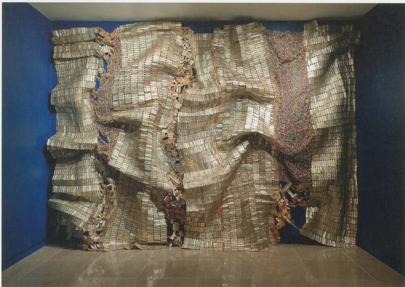
EL ANATSUI, GLI (WALL) , 2010, aluminum bottle caps, rings, copper wire, dimensions variable /

GLI (WAND) , Aluminium-Flaschenverschlüsse, Ringe, Kupferdraht, Masse variabel.