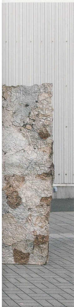
EL ANATSUI, WASTE PAPER BAGS, 2004–2010, printed aluminum plates, copper, variable dimensions / ABFALLSÄCKE, bedruckte Aluminiumplatten, Kupfer, Masse variabel.

genheit, Gegenwart und Zukunft kann immer nur vorläufig sein. Wie Anatsui bemerkt hat, wird dies durch das Überwiegen des Mündlichen als Hauptmodus des sozialen Diskurses und Gedächtnisses in afrikanischen Gesellschaften plausibel. Es ist dieser Zustand des Vorläufigen – mit all seinen philosophischen, existenziellen und formalen Implikationen –, den sein Werk anpeilt. 4)