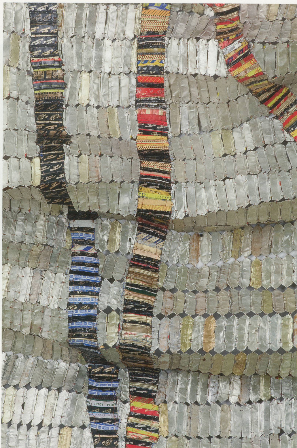
EL ANATSUI, DELTA, 2010, detail, aluminum bottle tops, copper wire, 183 x 135" / Detail, Aluminium-Flaschenverschlüsse, Kupferdraht, 465 x 343 cm.