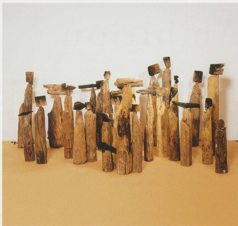
EL ANATSUI, AKUA'S SURVIVING CHILDREN, 1996, wood, metal, dimensions variable / AKUAS ÜBERLEBENDE KINDER, Holz, Metall, Masse variabel.