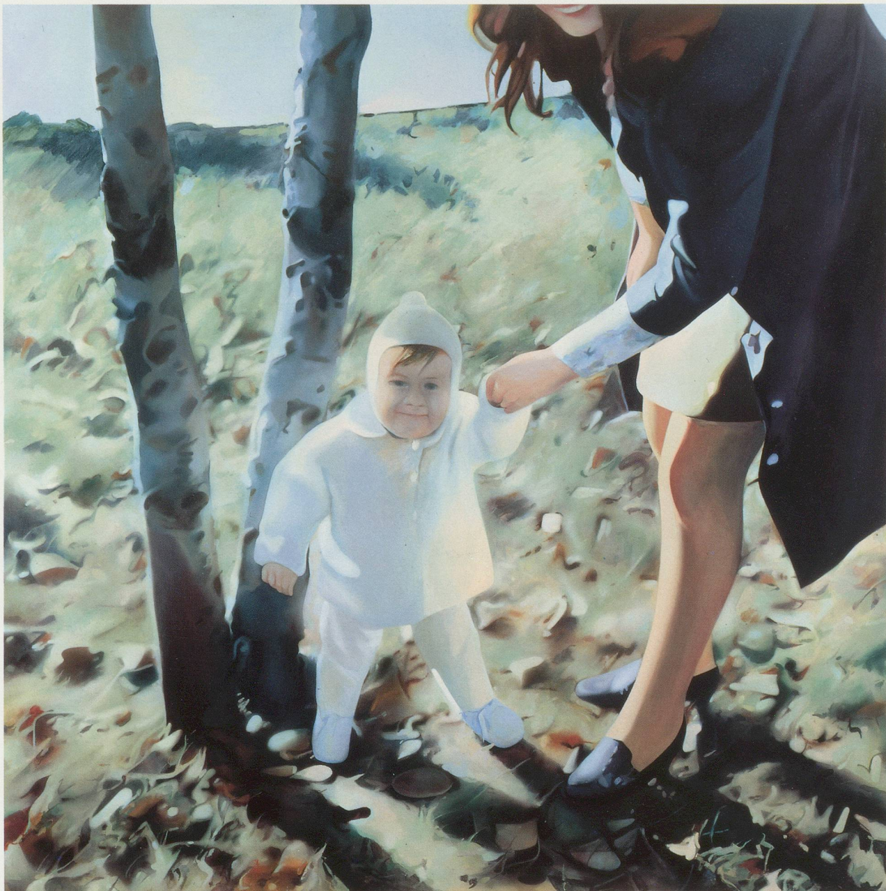
RICHARD HAMILTON, MOTHER AND CHILD , 1984–85, oil on canvas, 59 x 59"/ MUTTER UND KIND , Öl auf Leinwand, 150 x 150 cm.

turing closeness, etc, but what is ultimately most telling is the fact that for all its apparent banality the result is anything but banal.