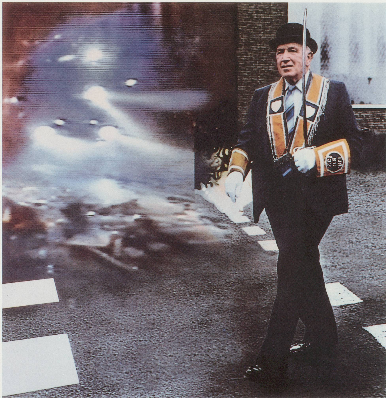
RICHARD HAMILTON, THE APPRENTICE BOY, 1987, dye transfer, 19 1 / 4 x 19 1 / 4 " (IMAGE); 24 3 / 4 x 24 3 / 4 " / DER LEHRLING, Dye Transfer, 48,8 x 48,8 cm (BILD); 63 x 63 cm (BLATT). (EDITION: 12).