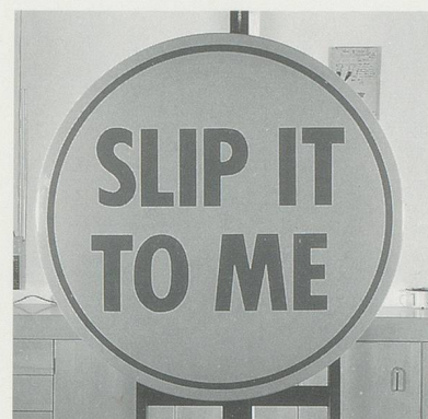
RICHARD HAMILTON, EPIPHANY, 1967–89, cellulose on aluminium, 45"/EPIPHANY, Cellulose auf Aluminium, 114 cm.

Im nachhinein lässt sich Hamiltons Werk nicht ganz so leicht einordnen: das Pop-Etikett ist nicht nur zu eng, sondern auch unzutreffend geworden. Im Zentrum seiner Arbeit liegt eine unerschütterliche, wenn auch paradoxe Treue zu einem Begriff von Malerei, der sie den Schönen Künsten zurechnet und der für Hamilton den ehrgeizigen Glauben an die Möglichkeit beinhaltet, ihre dahindämmernde Fähigkeit zu unüberhörbaren Aussagen über die Wirklichkeit wiederzubeleben, eine Fähigkeit, die eng mit ihrem mythenschaffenden Potential zusammenhängt. Das mag insofern paradox klingen, als viele seiner künstlerischen Aktivitäten sich stets über Kanäle geäussert haben, die nicht eigentlich der Malerei zugerechnet werden, also nicht bloss über verschiedene Formen der Druckgraphik, sondern über Photographie, verschiedene Typen von multiples , Schreiben und selbst Industriedesign; paradox