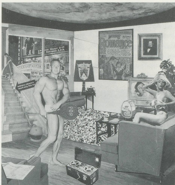
RICHARD HAMILTON, JUST WHAT IS IT THAT MAKES TODAY'S HOMES SO DIFFERENT, SO APPEALING? , 1956, collage, 10 1/4 x 9 3/4" / WAS IST ES NUR, DAS HEUTZUTAGE DAS HEIM SO ANDERS, SO ANSPRECHEND MACHT? , Collage, 26 x 25 cm.

DIFFERENT, SO APPEALING? of 1956, – not an exhibit but a design to be reproduced in the catalogue and on the poster for the exhibition entitled This is Tomorrow , (an exhibition which brought most of the former Independent Group members their first widespread public attention) – is generally considered the first Pop icon. That Hamilton should soon after have introduced such mass media material and styles into his own art and then, several years later, have enthusiastically championed the works of Lichtenstein and Warhol was seen to confirm his seminal place within the international Pop milieu. This view was, in turn, reinforced by such activities as the designing of a record sleeve for the Beatles, as well as by several of the highly idiosyncratic paintings that he produced in the mid-sixties, such as EPIPHANY of 1964, based on a button containing the phrase "Slip it to me" which he had found in a seedy Los Angeles joke store.