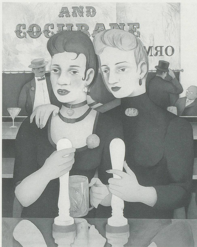
RICHARD HAMILTON, BRONZE BY GOLD , 1985–87, colour etching in 23 colours from 5 plates, 20 3 / 4 x 19 3 / 4 " (PLATES); 30 x 22" (SHEET)/ BRONZE MAL GOLD, Radierung aus fünf Platten in 23 Farben, 53 x 42,5 cm (PLATTE); 76 x 56 cm (BLATT).

to invoking art's highest aspirations as they are traditionally manifest in the conventions of history painting. The impetus for this comes partly from the recognition that while the traditional genres have a revered lineage in Western art many of them have lately become all but redundant: to grapple with them becomes therefore a challenge to update them, to render them, however temporarily, viable, and, equally