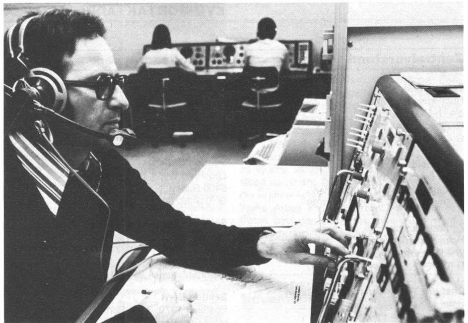
Das Bild zeigt einen Telefonie-Vermittlungsplatz der Küstenfunkstelle Bern Radio; Sender und Empfänger werden ferngesteuert. Im Hintergrund sind zwei Telegrafie-Arbeitsplätze sichtbar.

Der Kurzwellen-Sprechfunkbetrieb in SSB weicht von dieser Betriebsweise etwas ab. Hier arbeiten Schiff und Küstenfunkstelle mit je einer eigenen Sendefrequenz im echten Duplexbetrieb . Diese Paarfrequenzen sind fest vereinbart und veröffentlicht. Das Schiff ruft die Küstenfunkstelle auf und meldet den gewünschten Telefonteilnehmer auf dem Lande. Sobald die Küstenfunkstelle diesen Telefonteilnehmer erreicht hat, ruft sie das wartende Schiff auf. Darauf kann die Verbindung durchgeschaltet werden. Taxiart wird nur die eigentliche Sprechzeit der Teilnehmer. Will umgekehrt ein Landteilnehmer ein Schiff sprechen, so muss er manchmal 2–4 Stunden oder wenn sich das Schiff in einem Hafen befindet unter Umständen tagelang warten, bis sich das Schiff auf einen Aufruf in der mehrmals täglich ausgestrahlten Sprechfunk-Traffic List oder auf einen