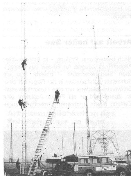
Durch die Dislokation der Sendeanlagen von Münchenbuchsee nach Prangins mussten zahlreiche Antennen neu aufgebaut werden.

Früher fehlten in der Schweiz Ausbildungsmöglichkeiten für Schiffsfunker. Interessenten hatten nur die Möglichkeit, eine ausländische Funkerschule (meistens die Seefahrtsschule in Bremen) zu besuchen. Die ausländischen Funkerschulen konnten aber nur jährlich 2–4 schweizerische Kandidaten berücksichtigen, so dass ein ausgesprochener Mangel an ausgebildeten schweizerischen Schiffsfunkern entstand. Viktor Colombo , damals von Berufes wegen mit diesen Problemen vertraut, gründete 1960 deshalb die Abendschule für Funker . Das Schulprogramm ist geschickt auf zwei Jahre aufge-