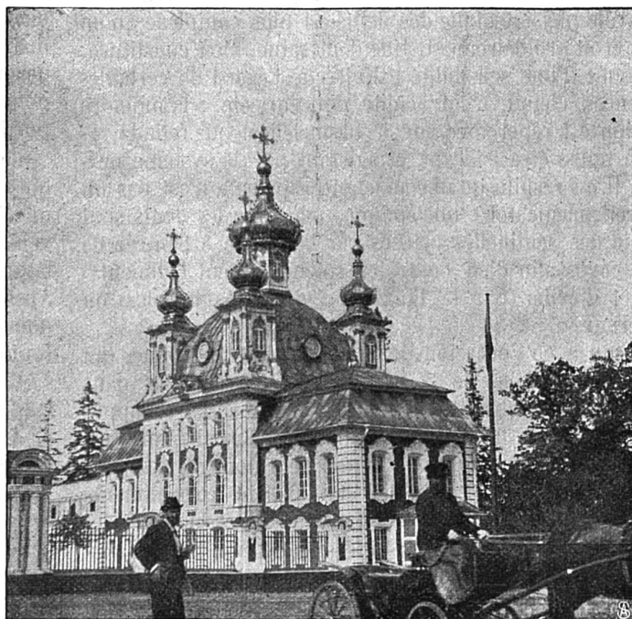
La CHAPELLE DU CHATEAU DU PETERHOF où fut baptisé le prince héritier russe Alexis