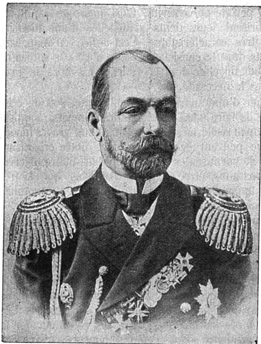
Amiral ROSCHDJESTWENSKY Commandant de la flotte de la Baltique

A peine hors des eaux russes, l'escadre a eu d'autres déboires; et l'on se souvient des démêlés avec l'Angleterre qu'elle a suscités au sujet du bombardement des petits navires de pêche, à 220 milles de l'embouchure de l'„Humber“. Croyant avoir à faire à des torpilleurs japonais, les Russes ouvrirent un feu violent qui coula le „Drane“, en tuant ou blessant plusieurs pêcheurs