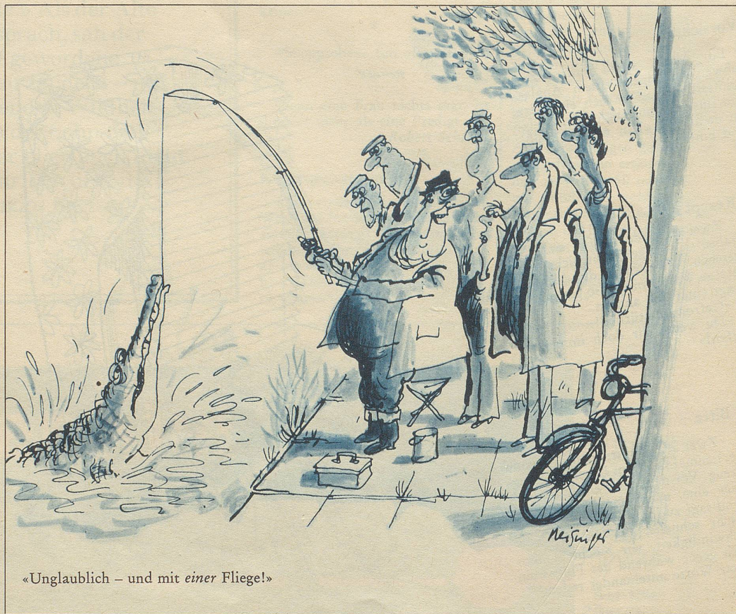
«Unglaublich – und mit einer Fliege!»

Man wäre es doch der célébrité des mondialement bekannten Namens schuldig, jede dieser Fragen geistprühend zu beantworten, den