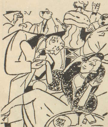
«Ich sehe nirgends Ihren Herrn Gemahl ... wird doch nicht krank sein?» «Glücklicherweise nicht ... er ist bloss im Gefängnis.»