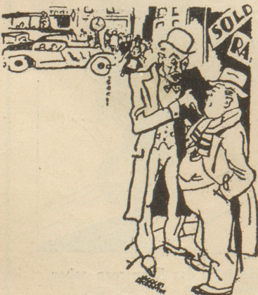
«Ich frage mich bloss, wohin wir noch kommen?» «Wohin weiss ich auch nicht, weiss bloss, dass wir mit Riesenschritten hinkommen!» (Le Rire, Paris)