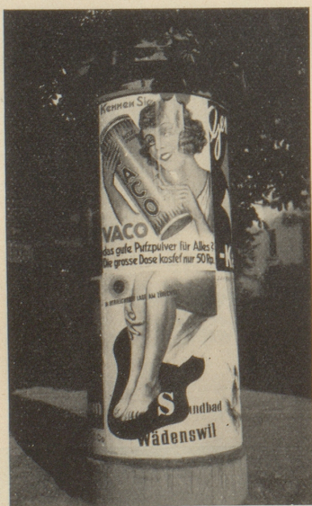
Die Zürcher Plakatanschläger haben Sinn für Humor

„I hätti gärn es Billet für ga Thun!“ „Eifach?“ „So eifach wie möglich!“