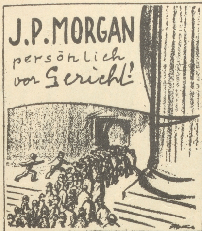
Die größte Sensation seit Barnum! (Saint Louis Post Dispatch)