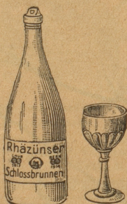
Goldene Medaille: Chur 1913

Sauerbrunnen Rhäzüns, Graubünden, hervor!