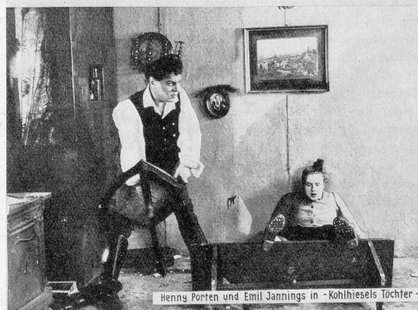
Henny Porten und Emil Jannings in «Kohlhiesels Töchter»