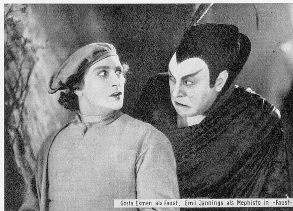
Gösta Ekman als Faust, Emil Jannings als Mephisto in «Faust»