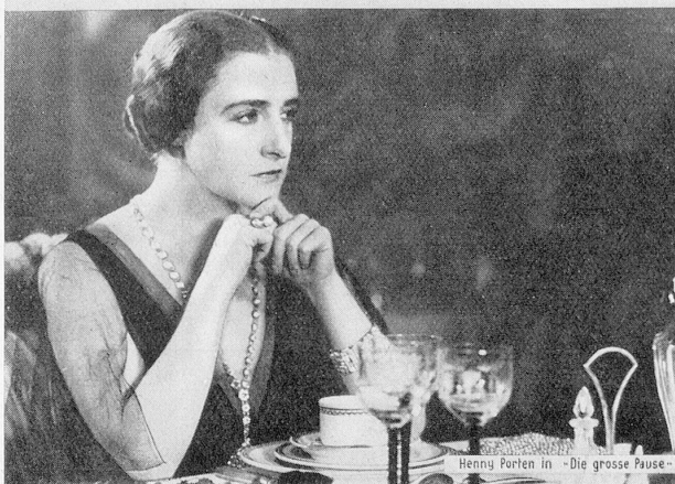
Henny Porten in «Die grosse Pause»