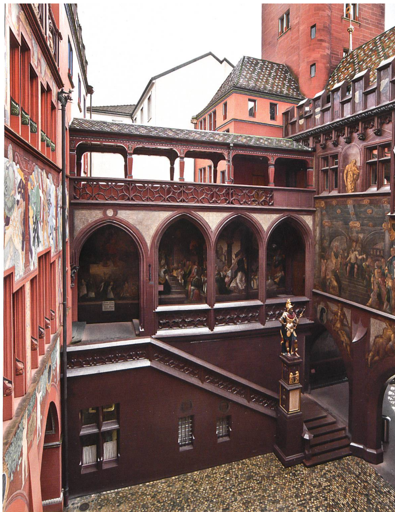
Abb. 7 Der Innenhof des Rathauses mit dem Blick auf die Laube von 1514 und die Freitreppe. An ihrem Fuss ist das 1580 geschaffene Standbild des römischen Feldherrn Lucius Munatius Plancus platziert, ein Werk des Bildhauers Hans Michel. Munatius galt als Gründer der Colonia Raurica, in deren Nachfolge sich die Stadt Basel verstand. Foto 2013. © Kantonale Denkmalpflege Basel-Stadt, Erik Schmidt

An der Hoffassade des Vorderhauses, auf einer Wandfläche neben den Fenstern des Regierungsratssaales, erblickt man eine weitere Gerichtsszene: Auf einem zentralen Thron sitzt ein recht junger, ernst dreinblickender Richter (Abb. 8). Die Geschichte ist bei Herodot überliefert: Der bestechliche Richter Sisamnes wurde auf Befehl des Königs Kambyzes hingerichtet und mit seiner Haut der Richtersessel bespannt. Auf dem Sessel musste der neu ernannte Richter, der Sohn des Sisamnes, Platz nehmen. Auf dem Gemälde sieht man in eine Säulenhalle, in deren Mitte der steinerne Thron um mehrere Stufen erhöht platziert ist. Der junge neue Richter ist inmitten seiner Ratgeber und Prozessbeteiligter wiedergegeben; die Haut seines Vaters dräut als formlose Masse zuoberst auf der Thronlehne. Das Bild wurde von Hans Bock um 1610 gemalt. Auch hier reihte sich Bock mit der Themenwahl in eine ikonographische Tradition ein. Gerard David