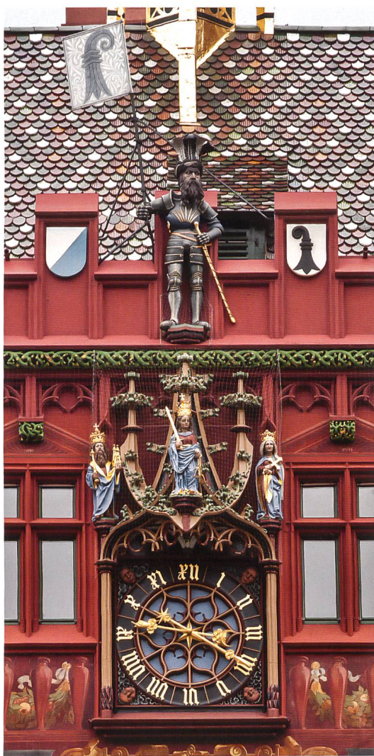
Abb. 2 Auf dem Baldachin der Rathausuhr stehen Figuren der Stadtpatrone Kaiser Heinrich II., seiner Gemahlin Kunigunde sowie die Muttergottes (die um 1608 in einem Akt reformatorischer Strenge in eine Justitia verwandelt wurde). Foto 2013. © Kantonale Denkmalpflege Basel-Stadt, Erik Schmidt

1501 hatte der Rat die Boten der schweizerischen Eidgenossenschaft in Basel empfangen, um in ihrer Anwesenheit den Beitritt Basels zu ihrem Bund feierlich zu beschwören. Der Vertrag war auf Dauer ausgelegt, und so mag ein Gefühl des neuen Zeitalters geherrscht haben – wenn auch die Entscheidung weniger krass empfunden worden sein mag, als sie sich heute an der EU-Grenze im Dreiländereck darstellt. Die Eidgenossenschaft und Basel scherten schliesslich nicht aus dem Deutschen Reich aus, wie Reichsadler und Kaiserkrone auf Wappenscheiben in der Basler Ratsstube deutlich machen. Peter Habicht hat den Blick darauf gelenkt, dass der Basler Rat im Bewusstsein des neuen Bundes seine Beziehung zum Bischof als Stadtherrn neu zu definieren suchte. 1 Der Rat verweigerte 1502 dem Bischof den Schwur auf die «Handfeste» (verbriefte Ratswahlordnung), nicht prinzipiell, aber weil er in der Formel die neue Stellung wiederfinden wollte. 2 Der Konflikt konnte erst 1506 durch einen Kompromiss gelöst werden, und so ist man geneigt, das anspruchsvolle Bauwerk als Ausdruck des Strebens nach Selbständigkeit und Macht zu deuten.