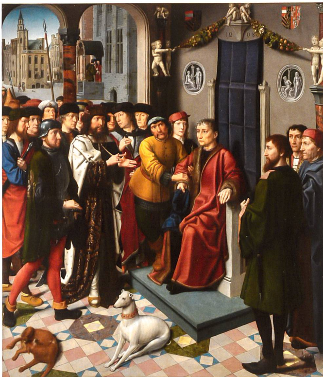
Abb. 9 Gerard David: «Das Urteil des Kambyzes», 1498.