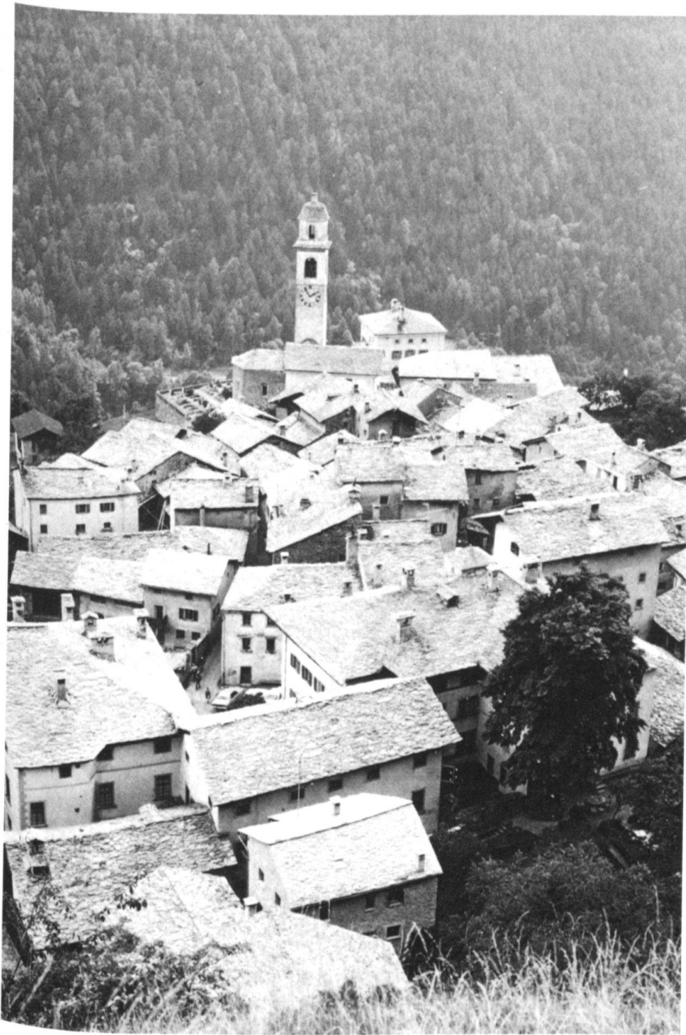
3 Soglio von Norden. Einheitliche Dachland- schaft, mit Quarzitplatten gedeckt.

glasierten Biberschwanzziegel des Erkerdaches am Haus Planaterra in Chur dürften bereits 1533 bestanden haben. Auf den Scharfenbänken an der gezinnten Westfassade des Schlosses Haldenstein sind Holzziegel der Zeit um 1550 nachgewiesen. Trotz zahlreicher Stadtbrände (1464, 1574, 1674, 1811) gelang es in Chur erst im 19. Jahrhundert, eine Hartbedachung auf Wohn- und Stallbauten durchzusetzen. Sebastian Münster schreibt 1556 in seiner Chronik über die Stadt Chur: «Man mag um die statt kein subtilen leimen (Lehm, Ton) zu den ziegeln dienstlich finden, darum werden die tächer so unflätig mit grossen schindlen und steinen gedeckt.» Obwohl seit 1574 Ziegel