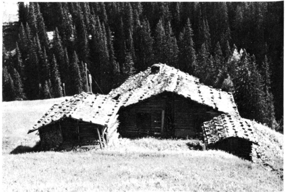
1 Langwies, Sapün/ Eggen. Maiensäss, Block- bauten mit Schwar- dächern.

gegen die «Verblechung» unserer Dachlandschaften gewandt, die er ja damals auch sehr «dachhautnah» miterlebte.