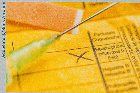
Impfungen: Bei Neugeborenen weniger wirksam.