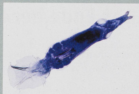
Der Plattwurm Gyrodactylus befallt die Kiemen von Stichlingen. Länge: 0,5 Millimeter.