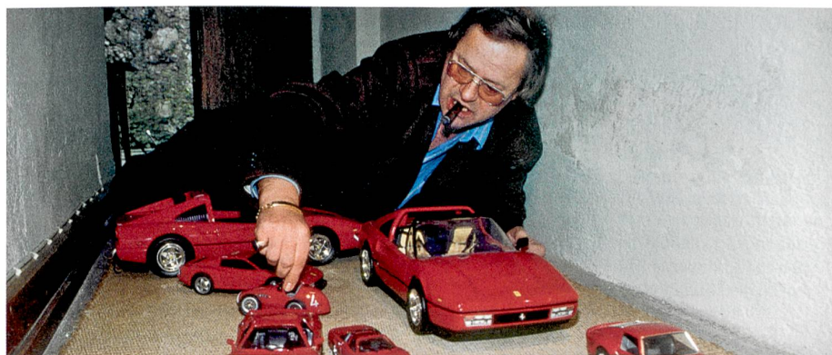
Inmitten der Boliden: der Literat und seine favorisierten Automobile

Während Jahrhunderten stützte der Staat eine Geschlechterordnung, welche die Herrschaft des Mannes legitimierte und Gewalt gegen Frauen tabuisierte. Ab den siebziger Jahren kämpfte die neue Frauenbewegung intensiv gegen diese Ordnung – mit grossem Erfolg. Im Kanton Zürich hat sich der Staat mit dem Inkrafttreten des Opferhilfegesetzes (1993) und des kantonalen Gewaltschutzgesetzes (2007) verpflichtet, bei Gewalt gegen Frauen die Opfer zu beraten und auf polizeilicher und juristischer Ebene zu intervenieren. Die vormals systemkritischen und privat finanzierten Beratungsstellen für gewaltbetroffene Frauen wurden staatlich anerkannt und finanziert. Dieser Erfolg hat freilich seinen Preis, zumindest für die Beratungsstellen, wie die Sozialarbeitswissenschaftler Peter Sommerfeld und Lea Hollenstein von der Fachhochschule Nordwestschweiz zeigen. Wegen der gestiegenen Fallzahlen und der Budgetrestriktionen, die mit den vom Kanton vorgegebenen Leistungsverträgen verbunden sind, kämen die Stellen nur noch begrenzt dazu, ihre einstige Kernaufgabe wahrzunehmen: sich intensiv um die traumatisierten Opfer zu kümmern und die der Gewalttätigkeit zugrunde liegende Problematik zu lösen. Eine quer zur ökonomisch und juristisch geprägten staatlichen Steuerung verlaufende Qualitätsdebatte sei notwendig, betonen die Forschenden. uha