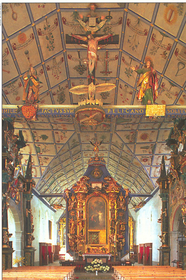
In der Wallfahrtskirche Hergiswald bei Kriens LU erzählen 324 Bildtafeln von den Tugenden Marias.

Von aussen gesehen verrät das Gebäude nicht, welche Schätze es im Innern birgt – eine kleine Barockkirche, wie man sie im Luzernerland so häufig antrifft, mit einem Glockenturm, der von drei kleineren Begleitern flankiert ist. Doch dem Betreten folgt das grosse Staunen: 307 farbige Bilder, je etwa einen Meter breit und zwei Meter lang, schmücken die Decke; 17 weitere befinden sich neben der Orgel über dem Eingang. In ganz Europa gibt es keine andere Kirche mit einer