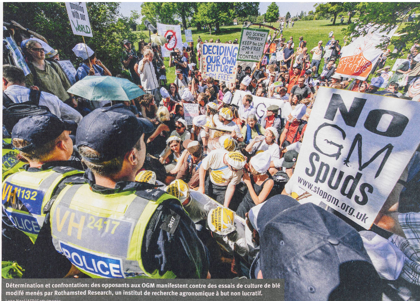
Détermination et confrontation: des opposants aux OGM manifestent contre des essais de culture de blé modifié menés par Rothamsted Research, un institut de recherche agronomique à but non lucratif.