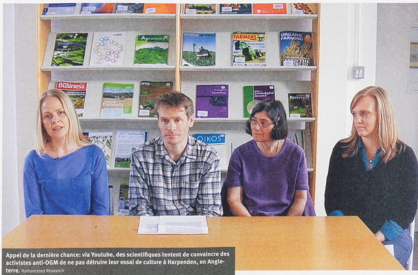
Appel de la dernière chance: via Youtube, des scientifiques tentent de convaincre des activistes anti-OGM de ne pas détruire leur essai de culture à Harpenden, en Angleterre.