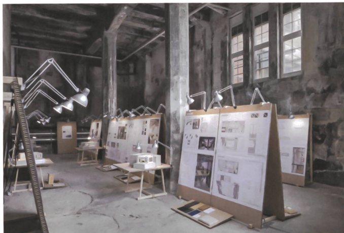
Die Ausstellung der Bachelorarbeiten des Studiengangs Innenarchitektur in der Viscose.

→ Dinge zu testen. Und sie wirken dem hohen wirtschaftlichen Druck etwas entgegen, der in den Innenstädten herrscht.» Sind weitere Zonen geplant, in denen sich die Kreativindustrie entwickeln kann? «Einige Standorte werden bereits abgeklärt», sagt Christen. «Es laufen Diskussionen zur Shedhalle an der Reussbühlstrasse.» An der Grenze zu Emmenbrücke, in Luzern Nord. Zudem versuchen private Initiativen, die einzelnen Kreativbranchen auch ohne gemeinsamen Arbeitsort besser zu vernetzen. Seit drei Jahren bringt die Plattform «Made in Lucerne» die unterschiedlichen Märkte an einen Tisch. Die Initiative «Luzern Design» siehe Themenheft von Hochparterre, Dezember 2011 schliesslich sorgt dafür, dass auch Designer und Wirtschaft zueinanderfinden. Von einem nahen Ende sei im «Neubad» nichts spürbar, meinen die Modedesignerinnen. «Wir hoffen, so lange wie möglich bleiben zu können. Danach geht es anderswo weiter – in Luzern oder sonst wo.»