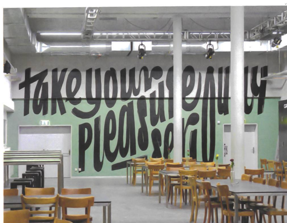
Die eigene Leidenschaft ernst nehmen: Wand-Typo für den «Südpol».