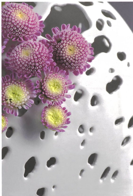
Christine Urechs «Vase»: Die unterschiedlich grossen Öffnungen ermöglichen es, Blumen aller Art einzustellen.