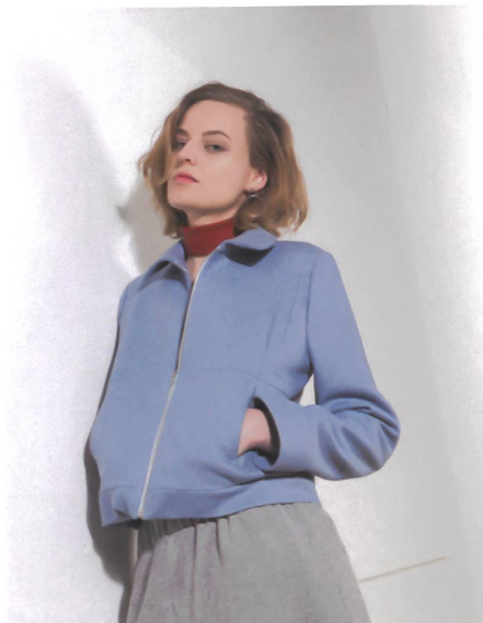
Die Jacke «Claire» erinnert an die Achtzigerjahre.