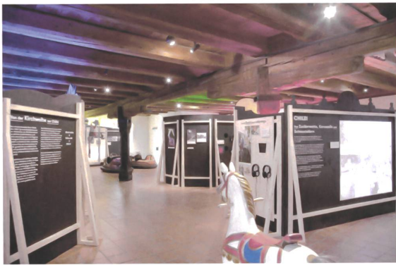
Die Ausstellung «Chilbi» im Historischen Museum Luzern.