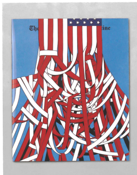
Cover für das «New York Times Magazine».