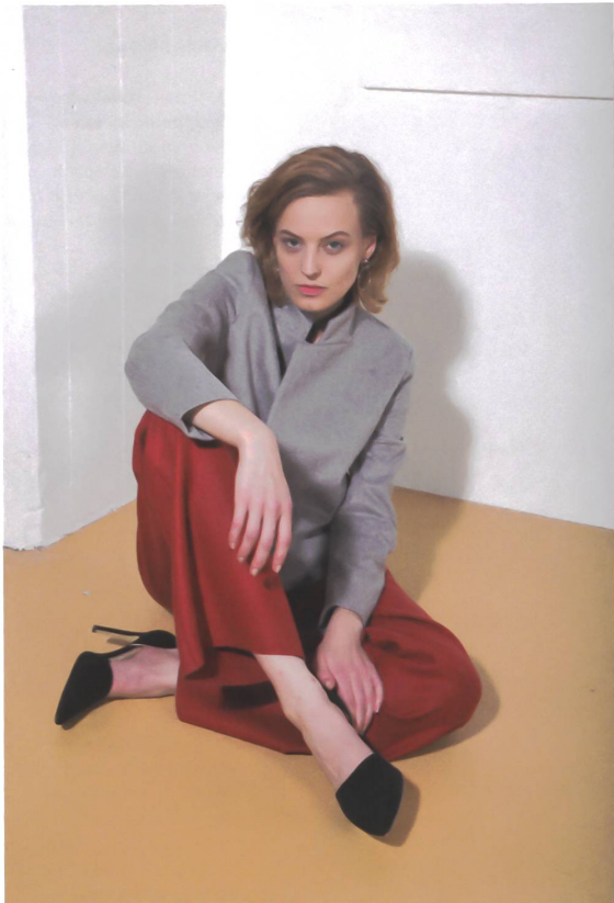
Die Jacke «Emma» interpretiert den Blazer neu.