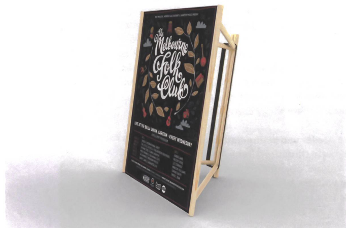
Zwei identische Seitenteile und ein Gummiband halten Postkarten an Ort und Stelle.