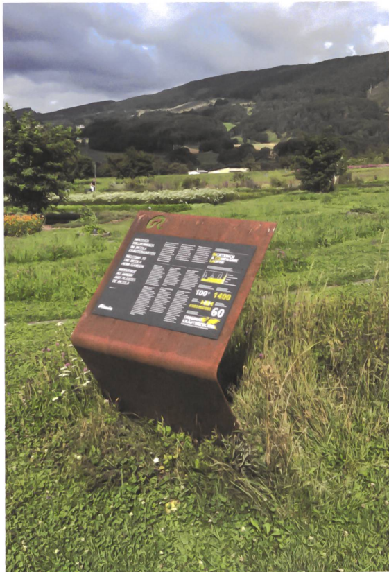
Die Besucherführung für Ricol's Kräutergärten in Laufen.