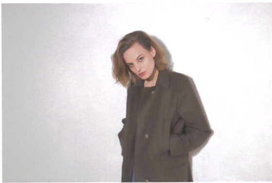
Der Mantel «Eden» aus der aktuellen Herbst-Winter Kollektion «fahren» von Velvet Novel.