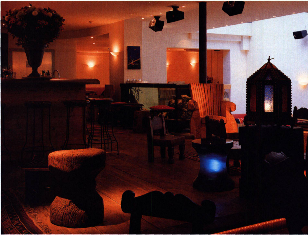
«Kaufleuten Lounge» Talacker 34, 8001 Zürich 01 / 225 33 66 (tägl. 18.30–2 Uhr)