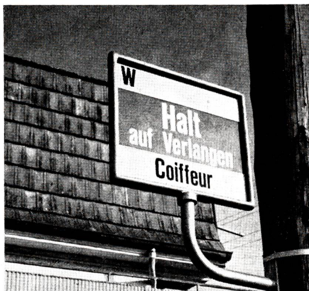
Wohl die einzige Station dieses Namens in der Schweiz! Sie befindet sich an der Linie Biel-Worben der städtischen Verkehrsbetriebe Biel.