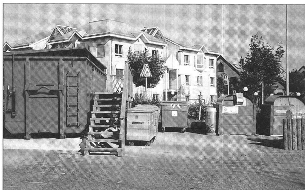
La déchetterie : nouveau théâtre de rencontres