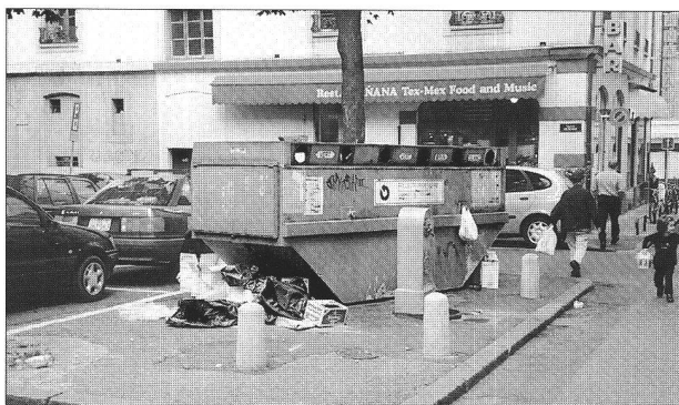
Une forme de récipient mal adaptée à la situation