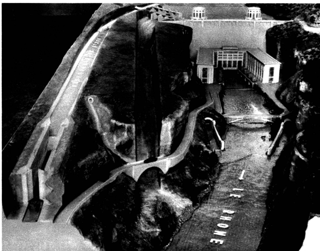
Le futur barrage de Génissiat.

La maquette montre, à gauche, le canal et l'écluse de navigation ; au centre, le canal pour l'écoulement des crues du fleuve ; à droite, le Rhône avec l'usine hydro-électrique et, au fond, le grand barrage surmonté des tours de prise d'eau. De chaque côté de l'usine, on aperçoit la sortie des canaux souterrains destinés à l'écoulement des eaux qui auront alimenté les turbines de l'usine.