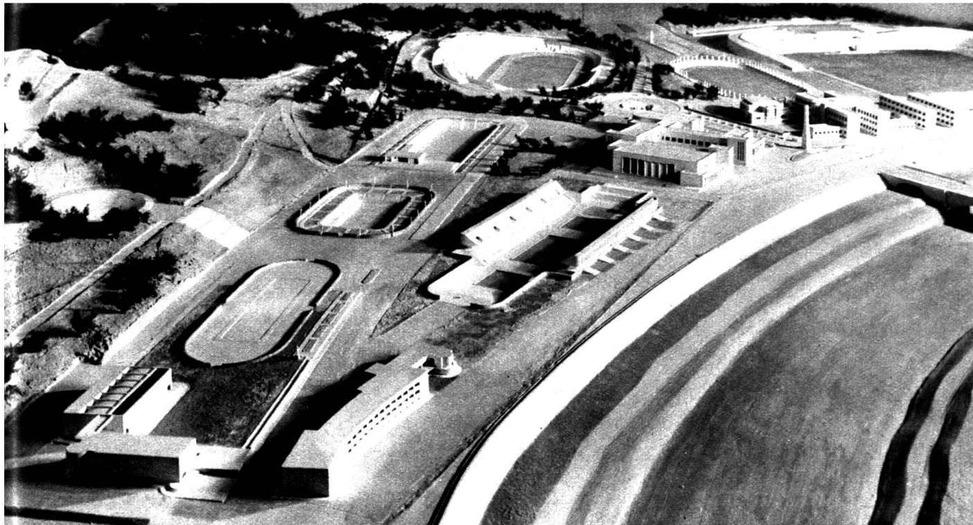
Le Forum Mussolini, à Rome.

Cependant, un examen plus attentif permet de constater que, dans ce domaine, un temps d'évolution est nécessaire. Il semble qu'en Italie on veuille tout ou rien. Si, d'une part, la nation a trouvé l'expression plastique de son caractère dans la construction et le renouvellement des villes, cet effort est nécessairement limité à un certain nombre de cités. Que deviennent les autres avant de recevoir le plan directeur et d'aménagement approuvé par le gouvernement? Des mesures intermédiaires telles que le « zoning » seraient à même de prévenir les erreurs inévitables avant l'établissement d'un plan définitif.