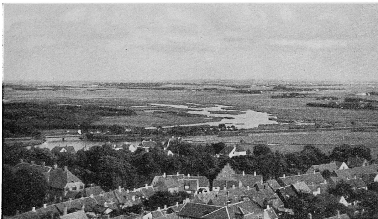
Blick vom Turm des Doms von Ribe, Richtung Nordsee. Natürliches Weideland mit Höfen und Weilern im Rückstaugebiet des Salzwassers.

finden. Die bäuerlichen Kleinbetriebe konnten ohne große Spesen, Zwischenhandelsverluste und Marktrisiken nur dann eine Veredlung aufziehen, wenn der Ein- und Verkauf zusammengelegt und die produzierten Qualitäten standardisiert wurden. Tatsächlich sind das dänische Frischei, die dänische Markenbutter und die dänische Schweinehälfte so normalisiert, daß man sie in Kopenhagen, in London und auf anderen Weltmärkten schon vor dem ersten Weltkrieg ungesehen nach Qualitätsbezeichnung kaufte und verkaufte. Neben der allgemein genossenschaftlich organisierten Verarbeitung der Milch in Betrieben, die meistens über 10000 Liter Tagesleistung haben, wird durch einen verzweigten Berater- und Konsulentendienst erreicht, daß die Fütterung der Kühe und Schweine so gleichmäßig ist, daß man gleichmäßige Produkte erzielt. Die Genossenschaftsmolkereien erfassen 90 % der Milch, die überhaupt von Molkereien bearbeitet wird; sie exportieren 47 % der dänischen Butter, 84 % der Schweine, 25 % der Eier und 39 % des Rindfleisches. Ebenso haben sie 67 % der eingeführten Futtermittel abgesetzt. Die Belehrung über den Wert und die Eigenschaften der Futtermittel und über die veränderte Wirtschaftslage ermöglichen allgemein eine gleichmäßige, die Nährstoffe richtig ausnützende Fütterung und eine Anpassung an den Markt, die sonst nie möglich wäre.