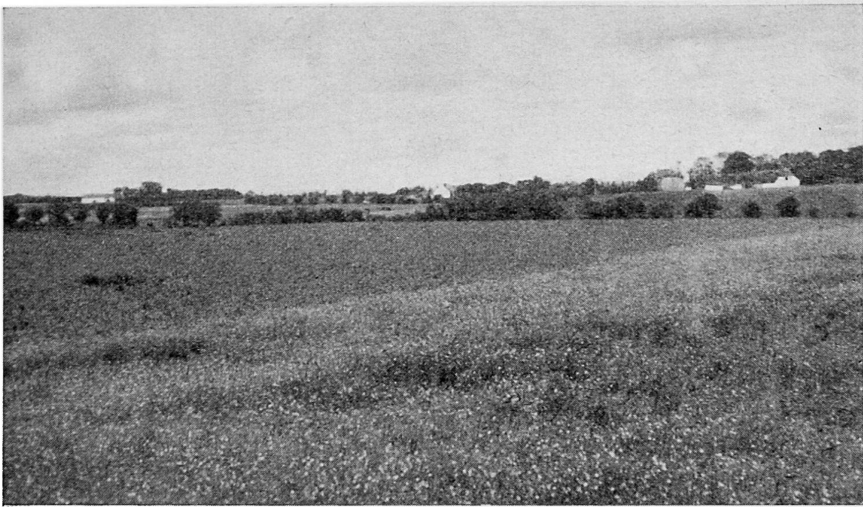
Typische dänische, von Lebhägen (Knicks) durchzogene Landschaft, in der die Einzelhöfe symmetrisch verteilt sind.

Ja, die mit dem Pflug bearbeiteten Flächen nehmen weiterhin dauernd zu. Der Umbruch von Naturwiesen wird heute noch als Fortschritt bezeichnet. Unter den auf dem Acker angebauten Früchten gewinnt jedoch der dem Futterbau dienende Teil wesentlich an Bedeutung.