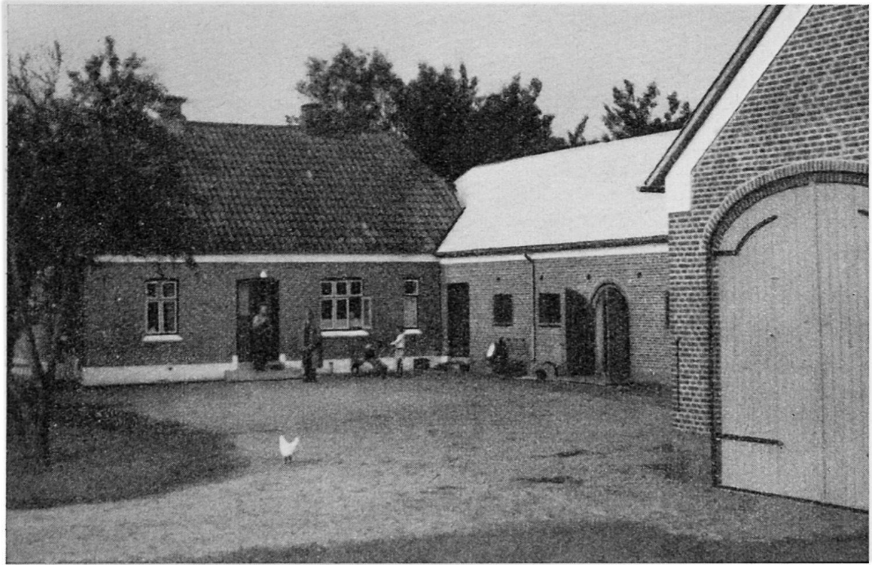
Dänischer Bauernhof. Typische Hufeisenanlage von Wohntrakt, Stall und Scheune. Größere Husmaend-Stelle von zirka 8 ha. An der Westküste häufiger in Backstein, an der Ostküste Fachwerk mit Kalkverputz.

Bei einem Vergleich der Leistungsklassierung nach Hartkorn mit der Flächenausdehnung scheinen die Herrenhöfe meist über 100 ha zu liegen, die Bauernhöfe im allgemeinen 10 bis 100 ha groß zu sein, während es fast ebenso viel Husmaend-Stellen gibt wie Betriebe unter 10 ha. Es ist deshalb fraglich, ob wirklich die meisten Husmaend-Insassen bei der gesteigerten Intensität der Landwirtschaft noch als Arbeiter mit Selbstversorgung angesprochen werden dürfen oder ob sie nicht eher als kleinbäuerliche Existenzen anzusehen sind. Sicher ist, daß auch diese Betriebe sich weitgehend an der Markt- und an der Exportproduktion beteiligen.