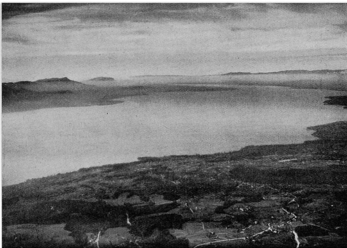
Le Léman vu des environs de Lausanne.