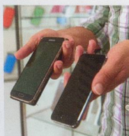
La majorité de l'occasion est en plein boom. Une solution pour les petits budgets.

On trouve de plus en plus facilement des appareils usagés, mais en bon état et à bon prix.