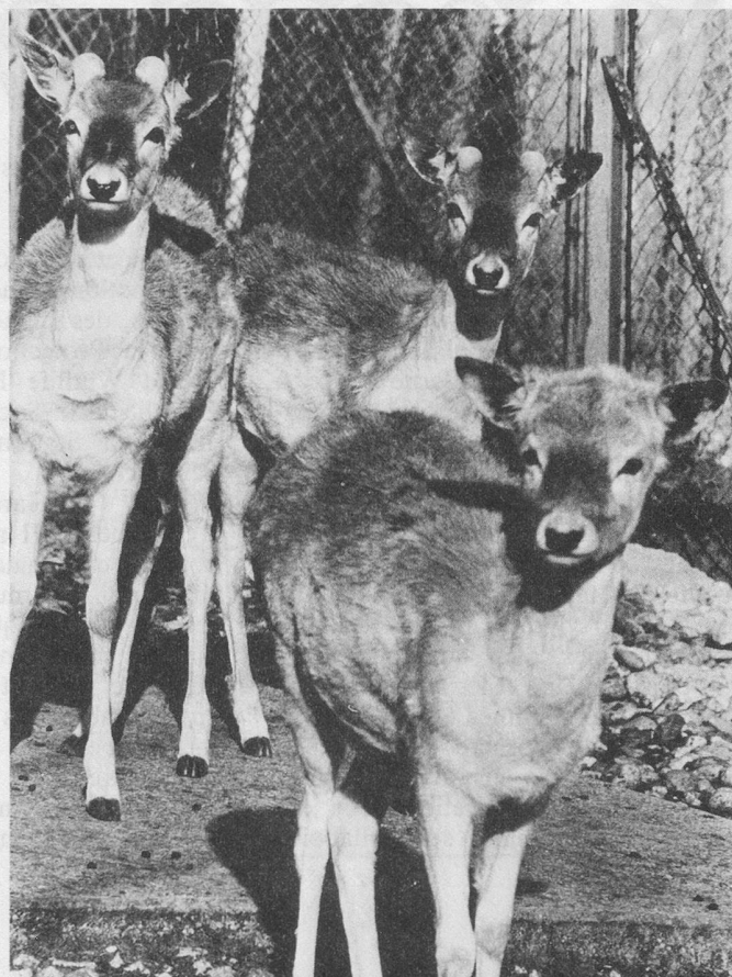
► Biches et daims : douceur et innocence.