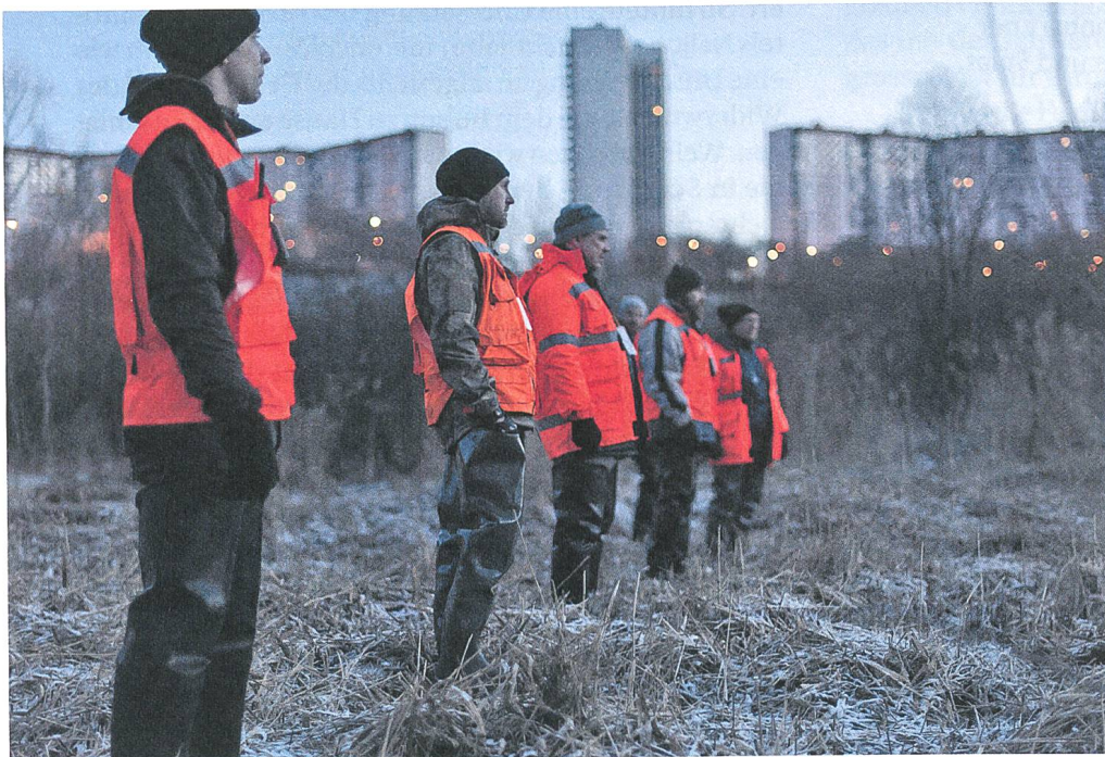
Loveless Regie: Andrei Swiaginzew