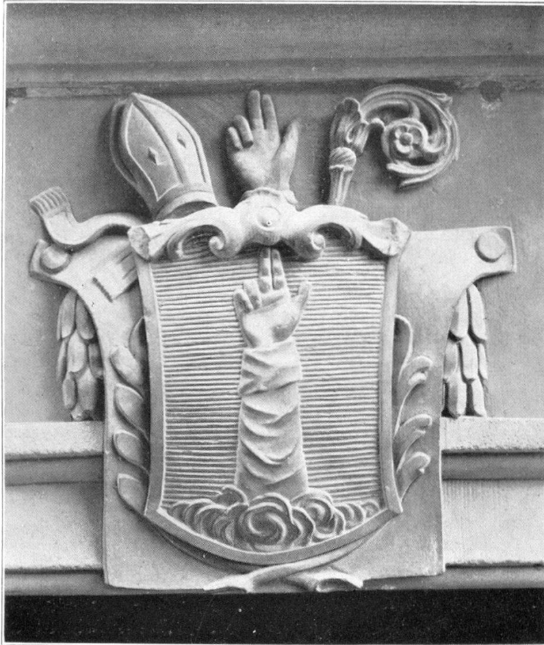
Stiftswappen als Türbegrönung der heutigen Propstwohnung Chorherrengasse Nr. 120. Steinskulptur. Dasselbe Wappen ziert in Flachschnitzerei die Haustüre des ehemaligen Propstes Tobie Nicolas Fivaz (1822-57), Reichengasse Nr. 140.