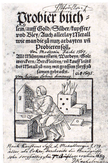
3 Titelbild des Exemplars der Eisen-Bibliothek, Erstausgabe der zweiten Serie.