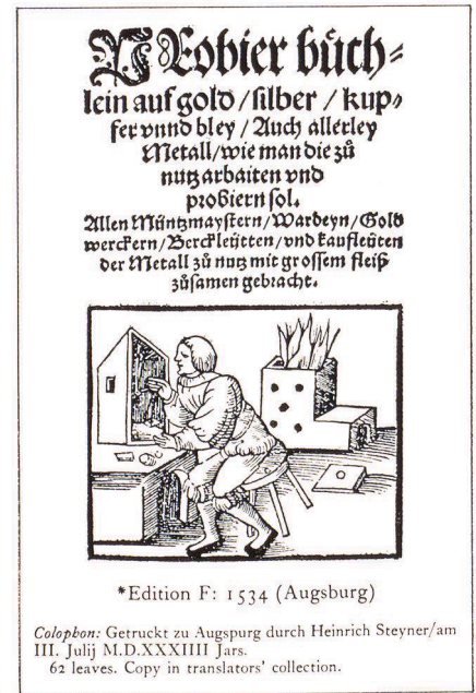
4 Datierte Ausgabe von Heinrich Steyner Augsburg 1534 zweite Serie, zweite Ausgabe (Sisco und Smith pg. 169)

erste nennen wollen, im Anhang ein Wörterverzeichnis der im Bergbau der Zeit gebräuchlichen Fachwörter enthält, und dass die Titelblätter der Ausgaben dieser Serie in Text und Illustration von Ausgabe zu Ausgabe verschieden sind.