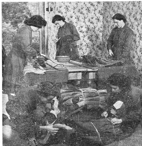
Un atelier du S.C. de nettoyage et d'assortiment des uniformes.