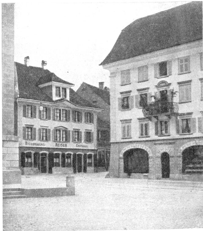
Bäuer am Rathausplatz zu Birsfelden.