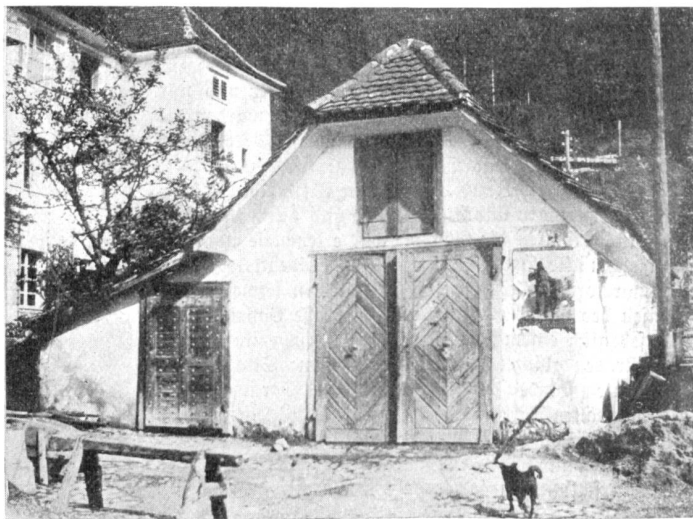
Oberkeittliches Spritzenhaus beim Rathaus zu Altdorf.

Der erste Band der Veröffentlichung, die jährlich einen Landesteil behandeln soll, schildert die Bürgerhäuser des Kantons Uri (Das Bürgerhaus in der Schweiz. I. Band. Das Bürgerhaus in Uri. Basel, Verlag von Helbing & Lichtenhahn, 1909. Preis Fr. 8.—). Es war ein besonders glücklicher Gedanke, gerade mit diesem echten Urkanton zu beginnen, dessen Bauart eine viel weniger bekannte, aber ebenso starke Eigenart aufweist, wie die irgend einer andern Gegend. Hier war die Grenze zwischen zwei mächtigen Kulturwelten. Deutsch redeten und dachten die Urner; aber nach Italien kamen sie, schon als Herren der ennetbirgischen Vogteien und dann wieder im Dienste der vielen italienischen Fürsten, und von dort brachten sie die Anregungen zu feinerem Geschmack, zu höherer Kultur der Lebenshaltung mit, die auch für den Bau ihrer Wohnhäuser bestimmend werden sollte. Nördlich der Alpen wird man kaum ein Tal finden, in dem die italienischen Einflüsse so unverkennbar stark gewirkt haben. Bis in die neueste Zeit hinein hat der Prozeß gedauert. Als nach dem großen Brande im April 1799 halb Altdorf neu aufgebaut werden mußte, als man sich endlich zur Vorschrist des Steinbaus entschloß, der freilich schon vorher bei den meisten vornehmeren Häusern angewandt worden war, da entstanden, in den ersten Jahrzehnten des letzten Jahrhunderts, die vielen behäbigen Wohnbauten, die in ihren Einzelheiten oft an Oberitalien anklängen und die im wesent-