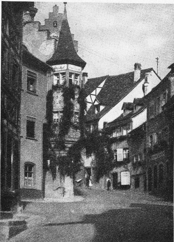
Altes Idyll am Hauptplatz von Meersburg am Bodensee.

Der junge Literat Levin Schücking war auch auf die Meersburg gekommen. Er hatte den Auftrag, die große Bibliothek des Freiherrn von Laßberg zu ordnen und einzurichten. Und Annette freute sich der Gelegenheit, in täglicher Verbindung mit diesem kundigen Manne zu bleiben. Der geistige Austausch nahm immer freundlichere Formen an. Annette fühlte sich mächtig emporgehoben. Der dichterische Born begann zu sprudeln; wie aus einem dumpfen Traum erwachte sie zu eifrigem Schaffen. Der Herbst und Winter 1841 auf 42 wurde zu einem Höhepunkt ihrer Produktion, und kaum ein Tag verstrich, an dem sie ihrem jungen Freunde nicht ein oder zwei neue Gedichte vorwies. Die 17 Jahre ältere Annette gedachte den jungen Dichter in mütterliche Obhut zu nehmen. An Liebe zu ihm, die später in ihr aufloderte, glaubte sie noch nicht. Schücking hat in seinem Roman „Das Stiftsfräulein“ die Worte der Drostse aufgenommen, mit denen sie selbst die Beziehungen zu Levin charakterisierte: „Ich will wie eine Verwandte für Sie sorgen, ich will Sie wie einen Bruder lieb haben, für den ich sorgen kann wie ein Weib, an dem ich eine geistige Stütze habe, denn meine Umgebung reicht nicht für mich aus; meine Gedanken gehen darüber hinaus und bewegen sich in einem Felde, das nur Sie auch betreten; aber wenn ich auch so gedankenarm wäre wie eine Köchin — es wäre doch dasselbe, ich will jemand haben, der mein ist, und dem ich wie einem geduldigen