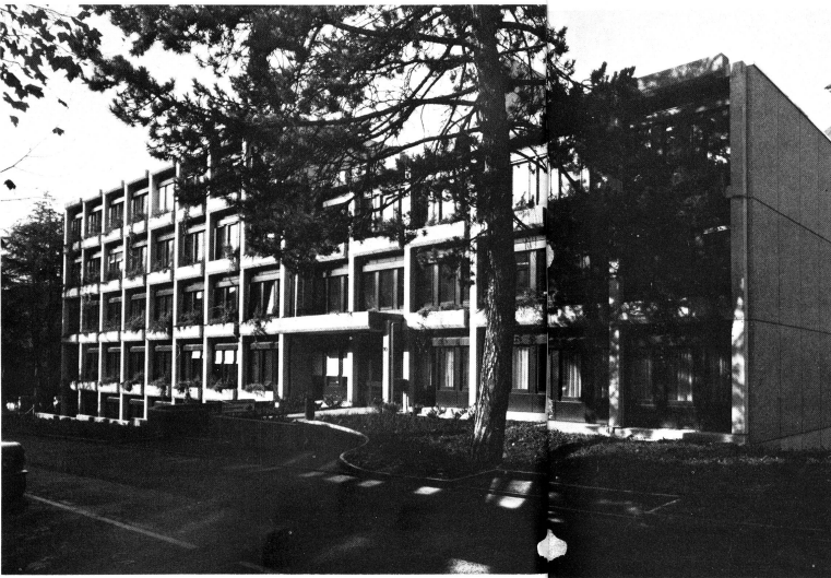
Nouvel immeuble du Secrétariat central de la Croix-Rouge suisse situé Rainmattstrasse 10, à Berne.

En dehors du Service du Secrétaire général proprement dit qui regroupe 5 personnes, le Secrétariat central comprend les services suivants: Le médecin-chef de la Croix-Rouge (7 personnes) – s'occupe de la mise sur pied du personnel soignant féminin nécessaire aux hôpitaux militaires; – coordonne les différentes organisations s'occupant de secourisme; – représente la Croix-Rouge dans le service sanitaire coordonné; – revêt la fonction de conseiller médical de la Croix-Rouge suisse.