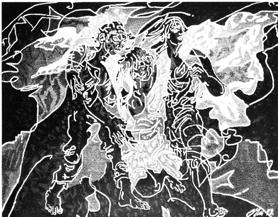
Tapisserie de Hans Erni décorant le hall d'entrée du nouvel immeuble du Secrétariat central de la CRS.