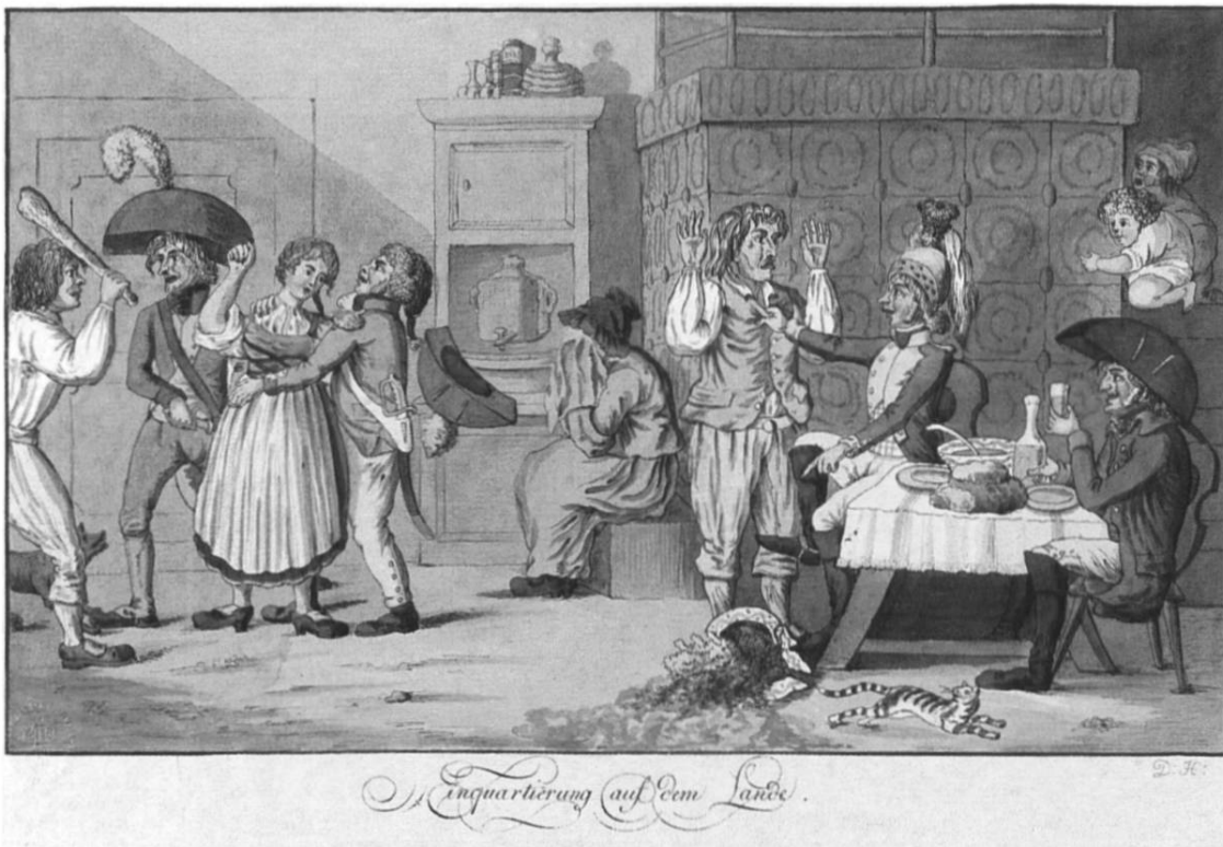
«Einquartierung auf dem Lande», Radierung von David Hess (Zürich, 1770–1843) aus dem Jahr 1801 (Schweizerische Nationalbibliothek, Bern). Von den Nöten des Volkes während der Besetzung der Schweiz durch die Franzosen in den Jahren 1798 bis 1803/1804 handeln in diesem Taschenbuchjahrgang die Aufsätze über den streitbaren Pfarrer von Embrach, Johann Jakob Schweizer (1771–1843), und über das Schicksal unehelicher Mütter und ihrer «Besatzungskinder».