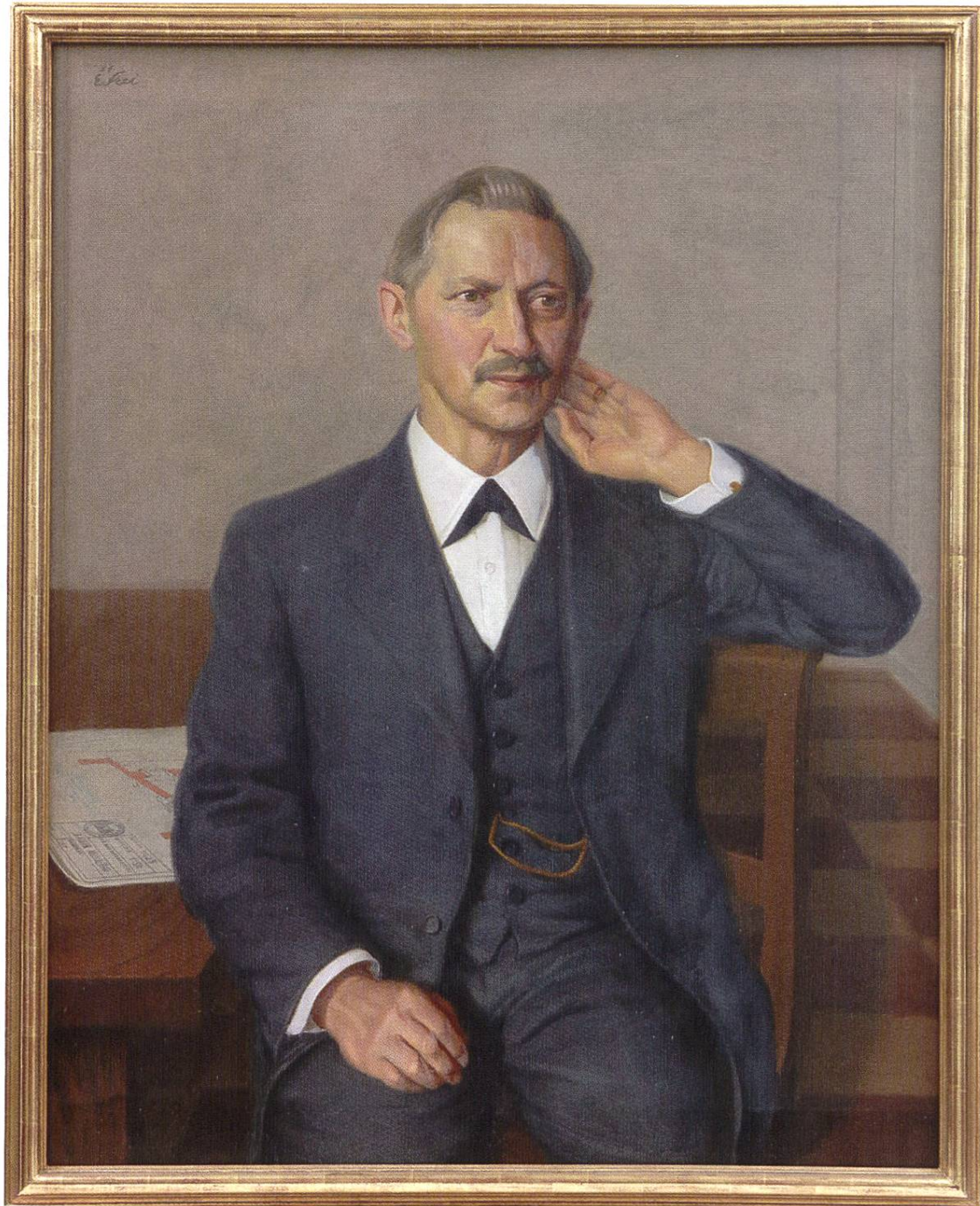
Rudolf Maurer (1872–1963) von Rieden/Wallisellen, Zürcher Regierungsrat von 1920 bis 1939 als Vertreter der BGB. Seine Lebenserinnerungen werden in diesem Taschenbuch vorgestellt von Christoph Mörgeli und Ulrich Maurer.