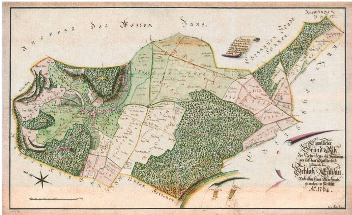
Der Zehntenplan von Hüntwangen, angefertigt durch Johannes Müller (1733–1816) im Jahr 1764 (Staatsarchiv Zürich, PLAN Q 196). Über die Zürcher Zehntenpläne als eine Quelle zur Geschichte des Landbaus im 18. Jahrhundert siehe den Beitrag von Samuel Wyder in diesem Taschenbuch.